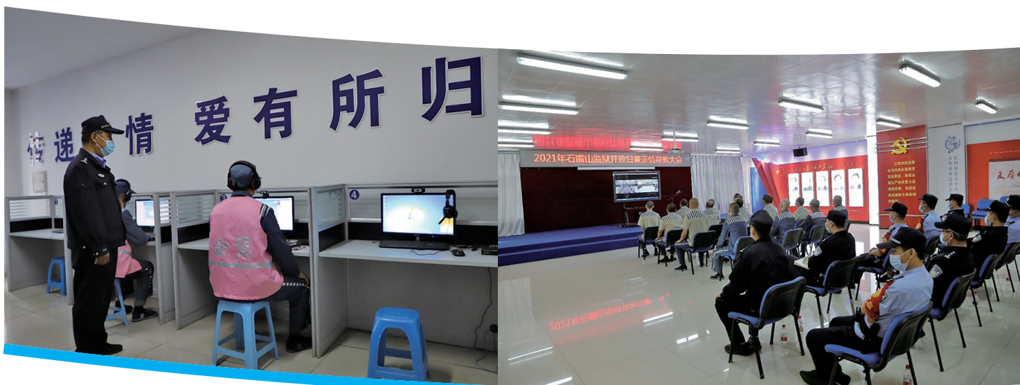
石嘴山监狱服刑人员拨打亲情电话。