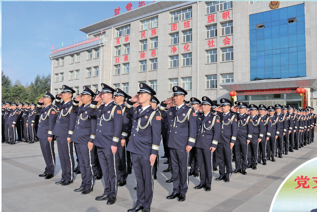
每周一举行升旗仪式。