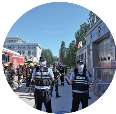
监狱警察与消防开展应急演练。