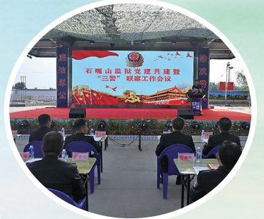
石嘴山监狱开展党建共建暨“三警”联席会。