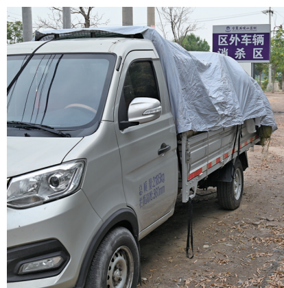
对区外进入监狱管理区的车辆进行专门消杀。

“我们将坚持政策从优、措施从优、情感从优，努力为一线干警职工减负增效，让他们在‘负重前行’的道路上轻装上阵，有效提升队伍的凝聚力、向心力和战斗力。”张国文说。