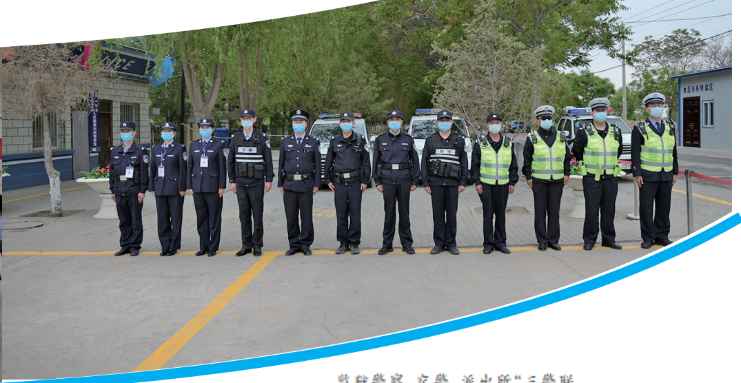
监狱警察、交警、派出所“三警联动”机制，有效维护监狱安全稳定。