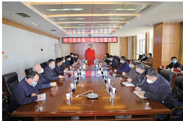
中卫市水务“一体化”交接仪式现场。