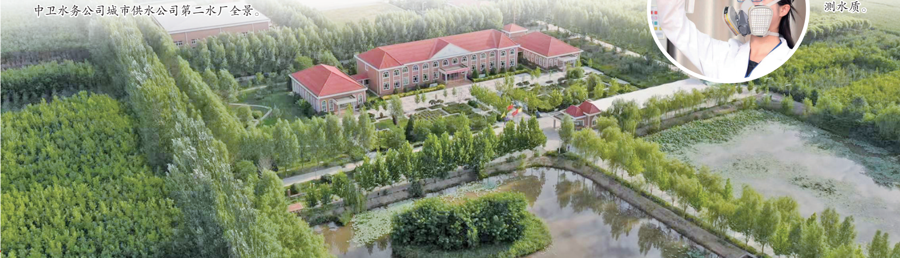
中卫水务公司城市供水公司第二水厂全景。