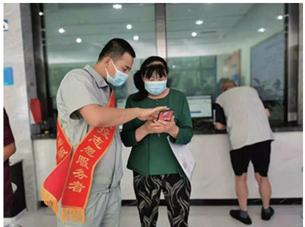
中卫水务客户服务中心为用户讲解线上缴费流程。