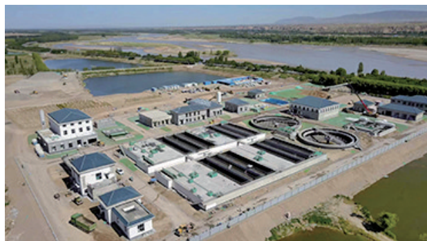
中卫水务公司第三污水处理厂全景。