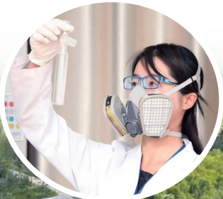
中卫水 务明源水质 检测公司检 测水质。