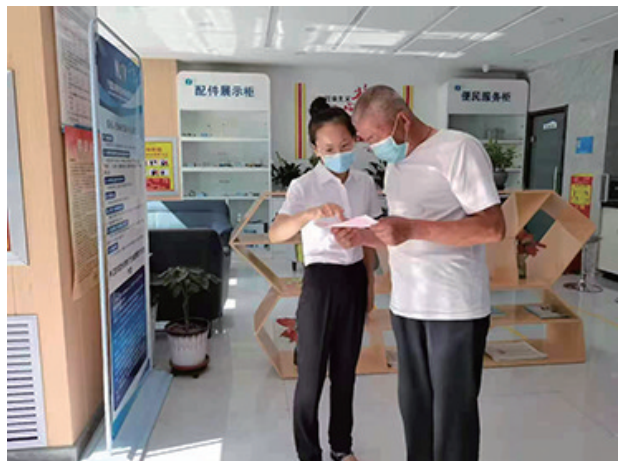
中卫水务公司客户服务中心人员为用户讲解水费收缴内容。

疾风知劲草，烈火见真金。2017年，宁夏水投集团有限公司积极履行国有企业的社会责任，成立宁夏水投中卫水务有限公司，全面肩负起了中卫市沙坡头区农村安全饮水项目运营管理及工程建设的重任。社会主义是干出来的，幸福是奋斗出来的。面对“争先进位阔步行”历史考题，中卫水务公司以“咬定青山不放松”的韧劲，催生出新时代不忘初心牢记使命的绚丽音符。面对星辰大海的征途，怎能不令人刮目？