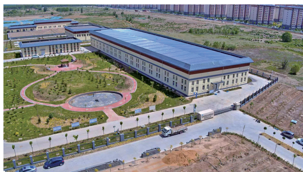
中卫水务公司城市供水公司第三水厂。