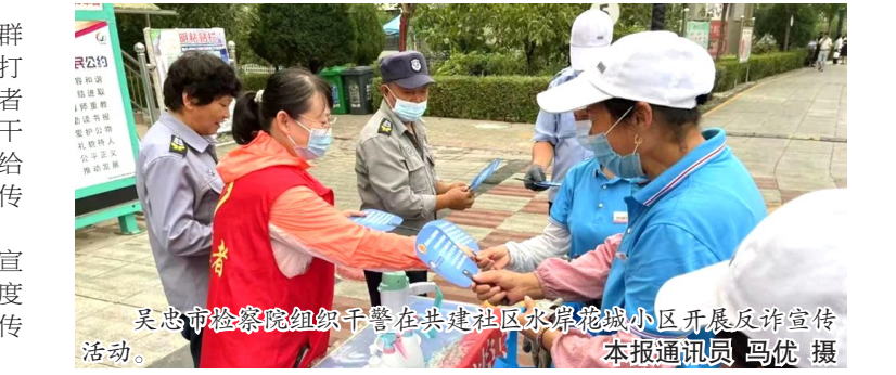
吴忠市检察院组织干警在共建社区水岸花城小区开展反诈宣传活动。

该院将持续加大养老反诈宣传力度，以接地气、入人心、有温度的方式灵活多样地开展反诈宣传工作。