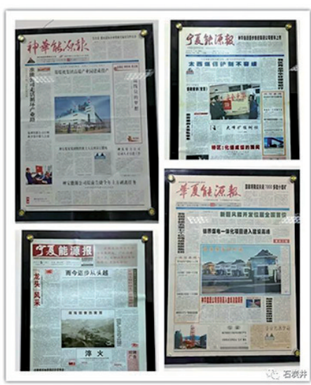
《石炭井矿工报》几经更名改版。