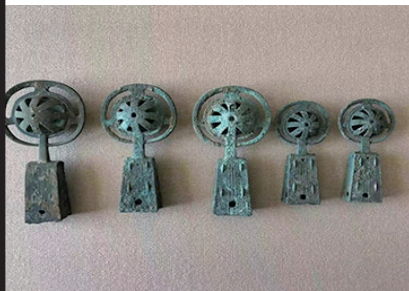
春秋战国时期车马器铃铛。