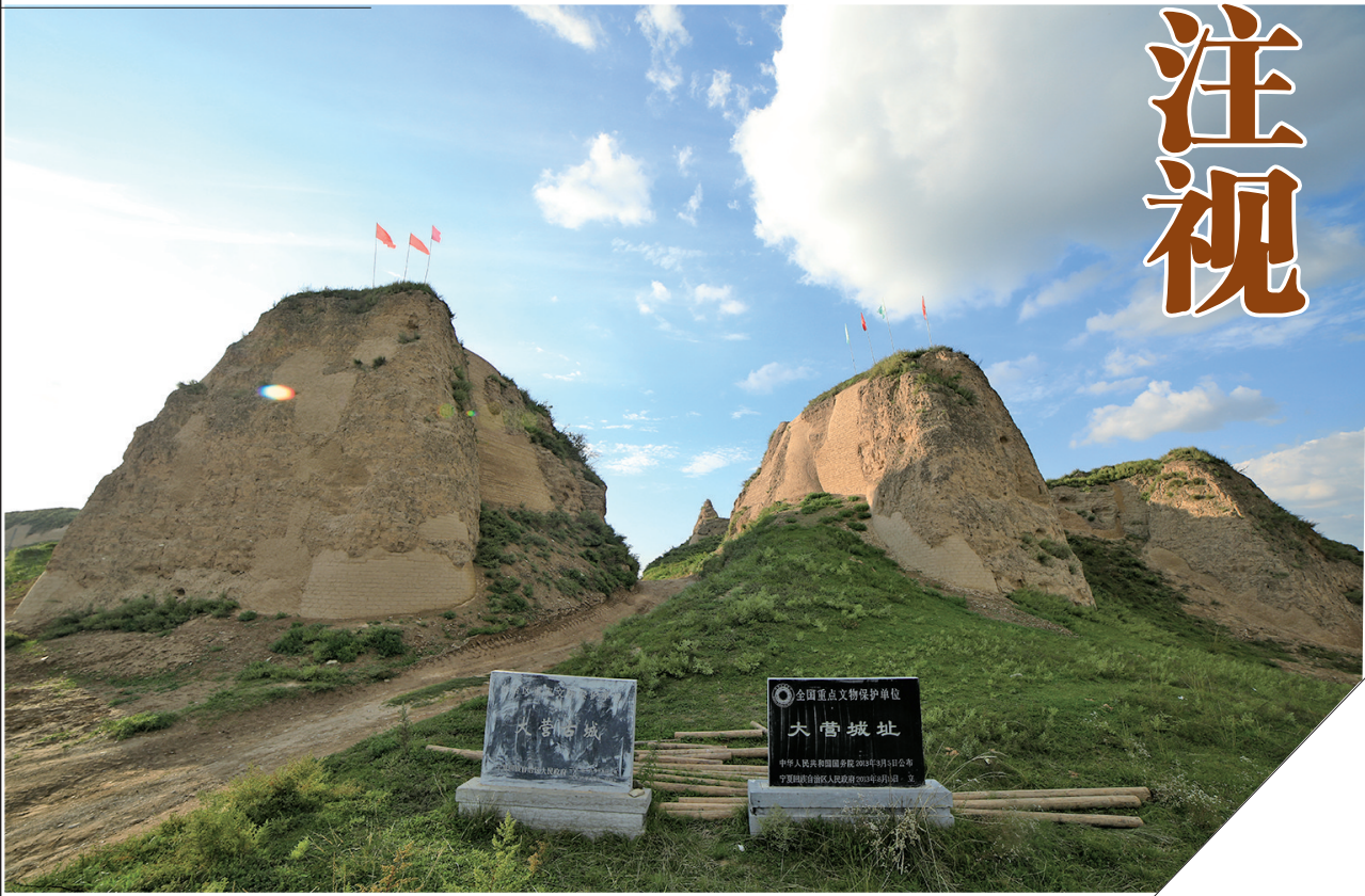
战国秦长城军事设施大营城遗址。

战国秦长城是秦昭襄王三十五年（前 272 年），秦昭襄王灭义渠国后，在其西北边界地区修筑的一道防御工事。这道长城西起甘肃临洮河谷东岸，经陇中高原，在固原地区穿陇山（六盘山）出宁夏，再次进入甘肃陇东及陕北黄土高原，止于鄂尔多斯市东胜区黄河南岸，全长 1700 余公里。