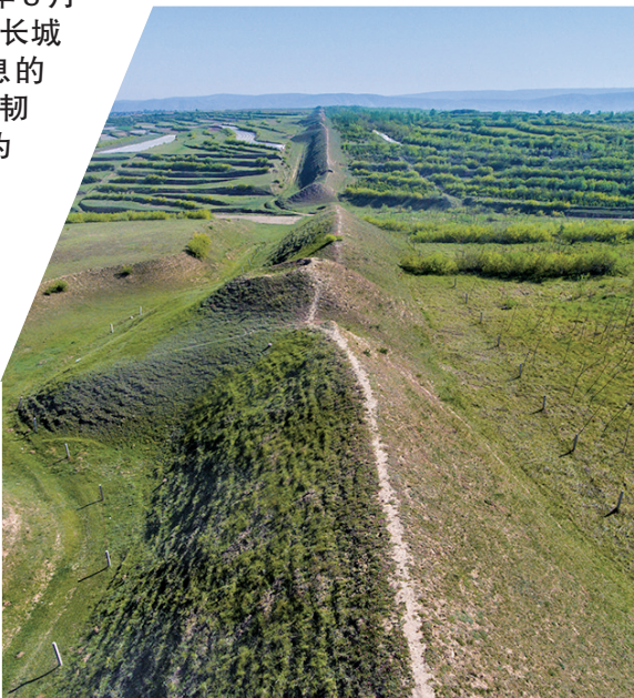
全国重点文物保护单位战国秦长城原州区明家庄梁段。

习近平总书记 2019 年 8 月 20 日在甘肃考察时强调：“长城凝聚了中华民族自强不息的奋斗精神和众志成城、坚韧不屈的爱国情怀，已经成为中华民族的代表性符号和中华文明的重要象征。要做好长城文化价值发掘和文物遗产传承保护工作，弘扬民族精神，为实现中华民族伟大复兴的中国梦凝聚起磅礴力量。”