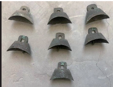
春秋战国时期车马器套铃。

修筑长城的目的主要是为了防御北方蒙古游牧民族统治者的骚扰，明朝在固原也有大规模修筑长城的历史。这就是固原境内除了战国秦长城外，还有部分明长城遗存。