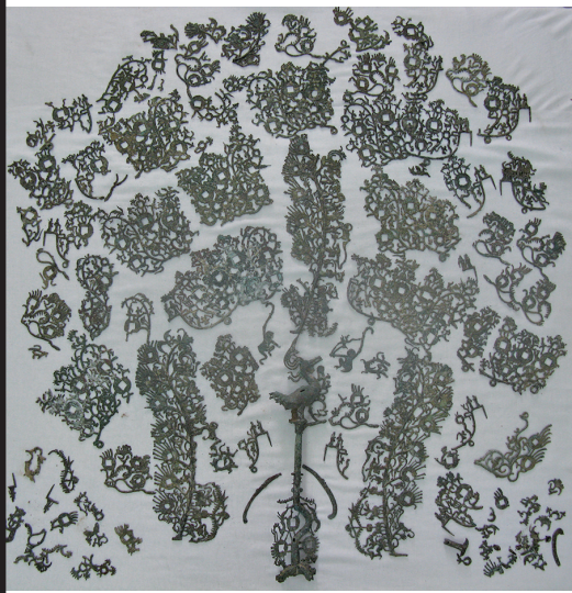
东汉人物杂技四神青铜鎏金摇钱树。

明朝自始至终对北方防务的建设非常重视。长城、关隘、墩堡的修筑工程，在明朝 270 多年历史中几乎没有中断过，逐步形成了“九边”分区防守，分段管理和修筑长城的制度。据《明史·兵志》记载，初设辽东、宣府、大同，延绥四镇继设宁夏、甘肃、蓟州三镇，而太原总兵治偏头，三边治府驻固原亦称二镇，是为“九边”。明长城对于明朝政权的巩固、北部地区农牧业生产的安定、国家的安全都起了积极的作用。在防务布局上采取列镇屯兵、分区防守。在修筑工程上采取分区、分片、分段包修。如 1952 年在居庸关、八达岭城墙发现的明万历十年（1582）石碑上就记载着长城的包修办法。明长城的九镇（九边）明朝为了便于对长城全线的防务管理和修筑，将全线分为九镇，委派总兵（亦称镇守）官统辖，亦称之为九边重镇。