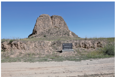
自治区文物保护单位同家墩烽火台。

发掘传承长城的文化价值、保护长城的文物遗迹，是时代赋予的使命，更是弘扬民族精神的最佳体现。