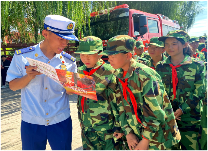
9月1日起，石嘴山市惠农区消防救援大队联合教育部门，以“开学第一课”和军训为契机，走进当地中小学，采取“理论+实操”的授课形式，开展消防知识宣传教育活动，倾力打造新学期“平安校园”。

本报讯（记者 丁丁 马涛）9月5日，西吉县偏城乡社区戒毒（康复）工作中心联合乡综合执法办在禁种铲毒常规巡查过程中，发现并铲除野生大麻120株。 据介绍，工作人员途经窑沟村白坩组时，发现乡村道路两边长有大麻原植物，通过走访和询问附近的村民及护林员后，排除