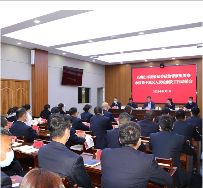
11月1日上午，石嘴山市委政法委政治督察组进驻红果子地区检察院，召开动员会，张贴公告，启动2022年度政治督察工作。

针对反诈、禁毒宣传时间、空间受限的实际，分局还积极对接大武口区环卫站和石嘴山市安道公共交通有限公司，利用环卫保洁车、公交车上路时间长、范围广、流动性强、接触群众的优势，将反诈、禁毒宣传“搬上”环卫车、公交车，让反诈和禁毒知识“流动”起来。今年10月，大武口区22辆流动环卫车、100余辆公交车已全部投放安装了反诈、禁毒音频视频，每日定时流动循环播放，反诈、禁毒语音传遍大街小巷，打造了流动反诈、禁毒宣传线，深入开展立体化反诈、禁毒宣传，形成全时空、高频率、广覆盖的反诈、禁毒宣传新局面。