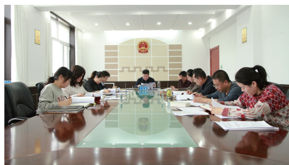
党组扩大会议学习党的二十大精神。

学习是筑牢思想的“压舱石”、压实进步的阶梯,只有不断地学习才能武装头脑,才能更好地推动工作。