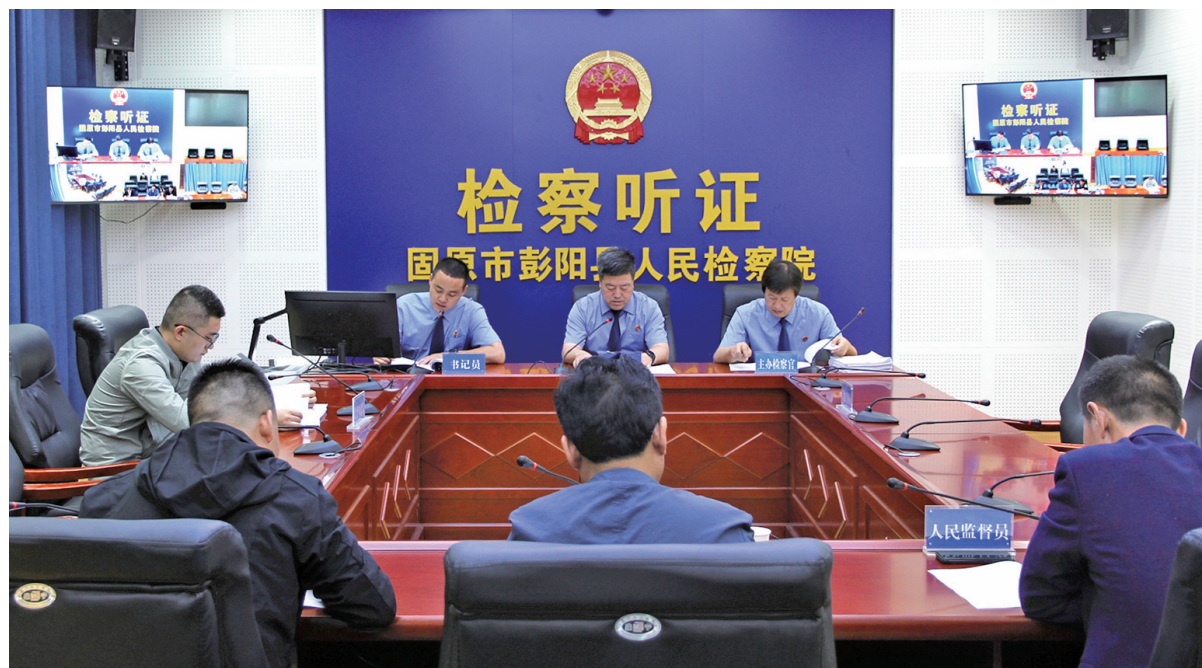
扎实推进检察听证,让公平正义可感可触。

党的二十大报告强调,要加强检察机关法律监督工作。今年以来,彭阳县人民检察院聚焦检察主责主业,发挥“四大检察”职能,护航生态彭阳绿色发展,维护社会公平正义,保障人民合法权益,以实际的工作质效提升群众的幸福感、安全感、获得感,为新时代的平安彭阳、法治彭阳建设贡献检察力量。