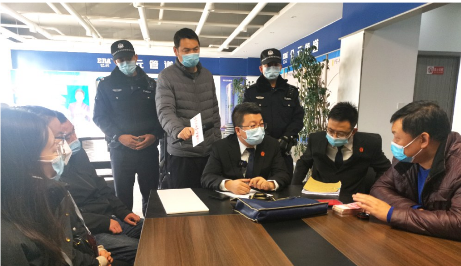
11 月 17 日,永宁县法院邀请媒体记者和人大代表、政协委员现场监督、见证执行工作。

货款。原告 11 月 6 日与快递公司核实发货、到货的货物重量,发现货物并未少发,多次给马某打电话协商退款事宜,马某均