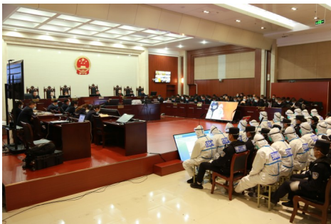
“3·28”特大电信网络诈骗案庭审现场。

以干警素能为根本,把心思定位在实作风上,着力锻造过硬队伍。通过“村官教法官、法官教法官、师傅带徒弟”“岗位大练兵、技能大比武”“院庭长大调研”等方式,积极开展庭审观摩、裁判文书评比、法官助理和书记员业务竞赛,以业务学习促钻研,以办案方法促研究,有效提升队伍辨法析理、做群众工作的实务能力。