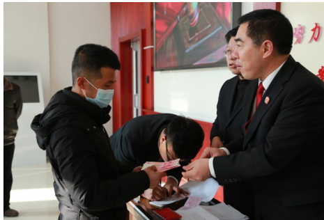
法官为农民工集中发放追回的工资。