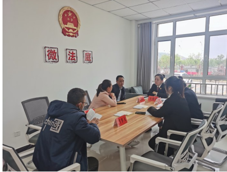
西吉法院“微法庭”现场调解案件。

“没想到你们在村上都没有法庭,在家门口就能解决问题,真是太方便了。”调解结束后,双方当事人如释重负,对“微法庭”的便民高效连声称赞。