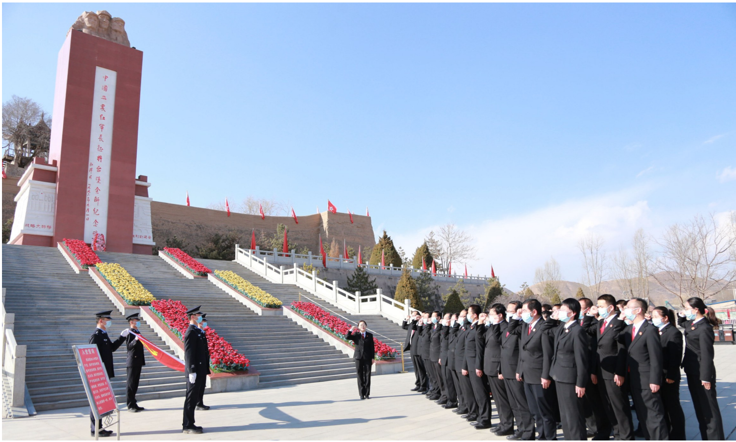
西吉法院干警重温入党誓词,凝聚奋进力量。