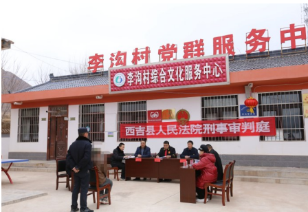
巡回审判方便于民。

同时,全力创建“无讼”乡村(社区),将矛盾纠纷化解在农家庄院、田间地头,实现“小纠纷不出组,大矛盾不出村、不出社区”,创建的2个“无讼”乡村试点就地化解矛盾纠纷32起。创新发展新时代“枫桥经验”,推行“诉源治理”“分调裁审”,全面加强诉前调解和诉调对接工作,努力构建“社会调解优先,法院诉讼断后”的递进式纠纷分层解决体系,兴隆、震湖、新营人民法庭先后获得“塞上枫桥人民法庭”称号。