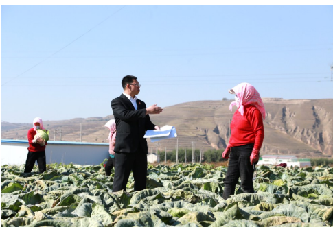
法官在田间地头解决群众诉求。

党的二十大召开后,该院有步骤、分层次、多形式深入学习宣传贯彻党的二十大精神,书写忠诚、民生、奋斗、作风四张答卷,推动法院