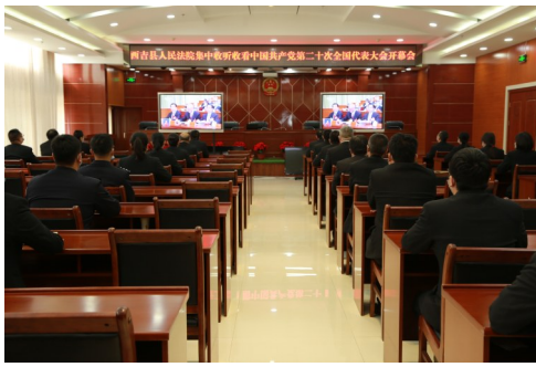
西吉法院干警集中观看党的二十大开幕会。