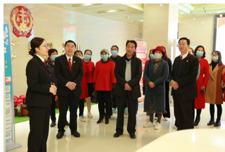
西吉法院倾听社会各界心声促公开。

12368诉讼服务热线等平台,实现诉讼事务“家里办”“掌上办”,在线调解案件1786件,成功率65.36%。开通老年人、残疾人等人群“绿色通道”,立案、审理、执行做到优先、便捷,筹措43万余元对33名困难当事人进行司法救助,让行动不便、生活困难的群众感受到司法的温暖。强化阳光司法,网上“晾晒”裁判文书1323份、庭审直播248场次,以司法公开倒逼司法公正,让当事人赢得清楚、输得明白。