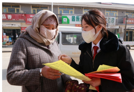
西吉法院干警在街头开展普法宣传。

同时,全力创建“无讼”乡村(社区),将矛盾纠纷化解在农家庄院、田间地头,实现“小纠纷不出组,大矛盾不出村、不出社区”,创建的2个“无讼”乡村试点就地化解矛盾纠纷32起。创新发展新时代“枫桥经验”,推行“诉源治理”“分调裁审”,全面加强诉前调解和诉调对接工作,努力构建“社会调解优先,法院诉讼断后”的递进式纠纷分层解决体系,兴隆、震湖、新营人民法庭先后获得“塞上枫桥人民法庭”称号。