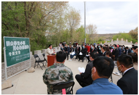
西吉法院干警聆听基层党支部书记讲党课。

该院采用全院“大课堂”集体学、庭室“小课桌”跟进学、干警“自习室”自学和主题研讨交流的“3+1+N”学习模式,研学习近平新时代中国特色社会主义思想 and 习近平法治思想,深学党的十九历次全会精神、党的二十大精神、习近平总书记视察宁夏重要讲话和重要指示批示精神,扎实开展“两个确立”主题教育、习近平总书记视察宁夏重要讲话和重要指示批示精神“四大”活动,坚定不移举党旗、听党话、跟党走。