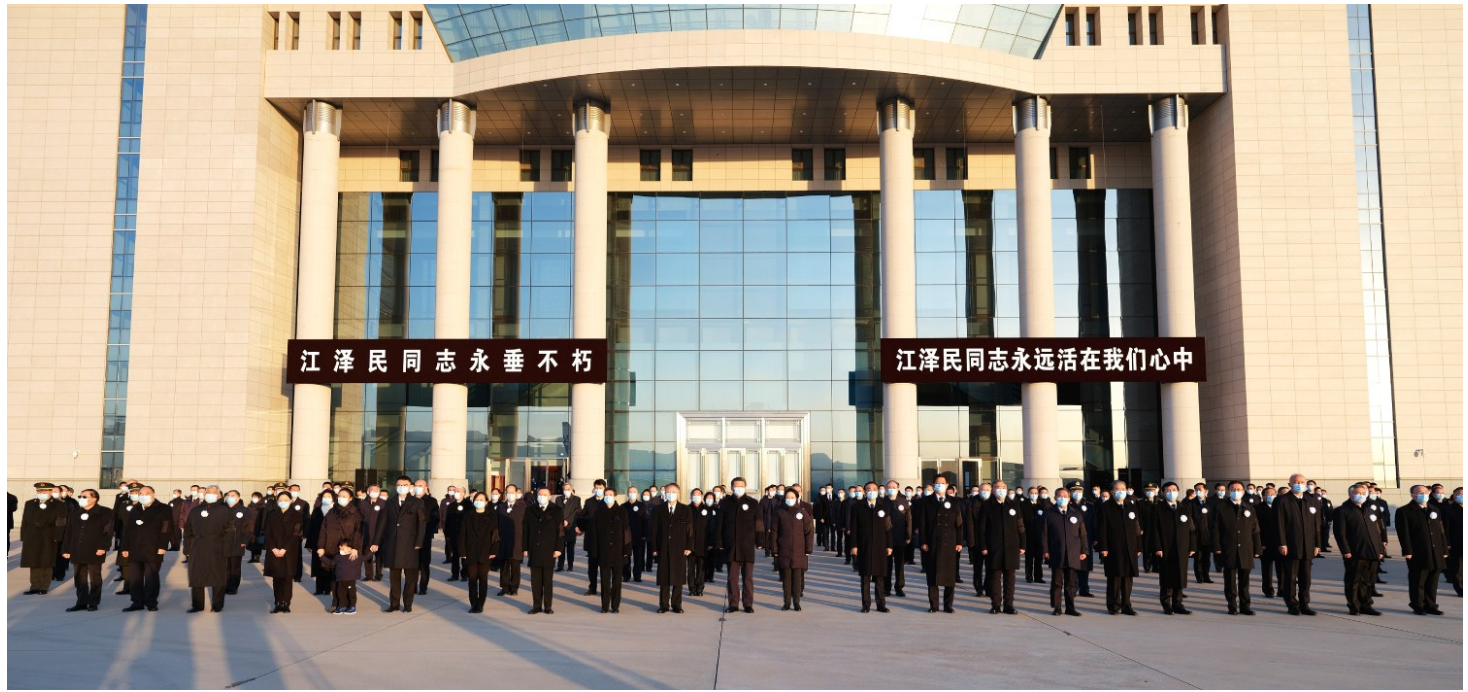
12月1日,江泽民同志的遗体从上海由专机敬移到达北京。