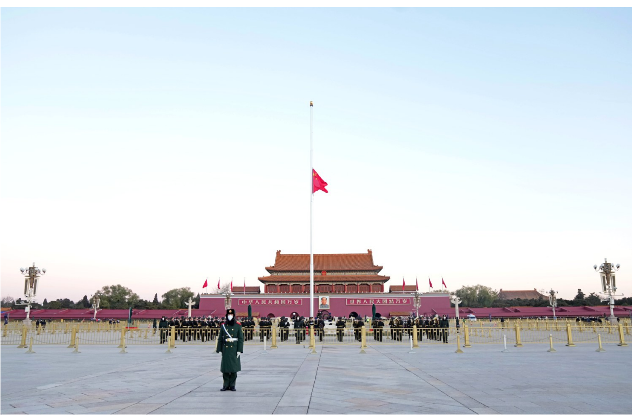
12月1日,北京天安门下半旗志哀,悼念江泽民同志逝世。

中央组织部、中央统战部、中联部的同志表示,江泽民同志目光远大、审时度势,总是从中国和世界发展大势、从党和国家工作全局出发观察和思考问题,不断推进理论创新和其