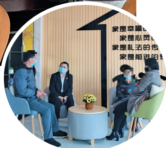
家事审判法庭法官为案件当事人做调解工作。