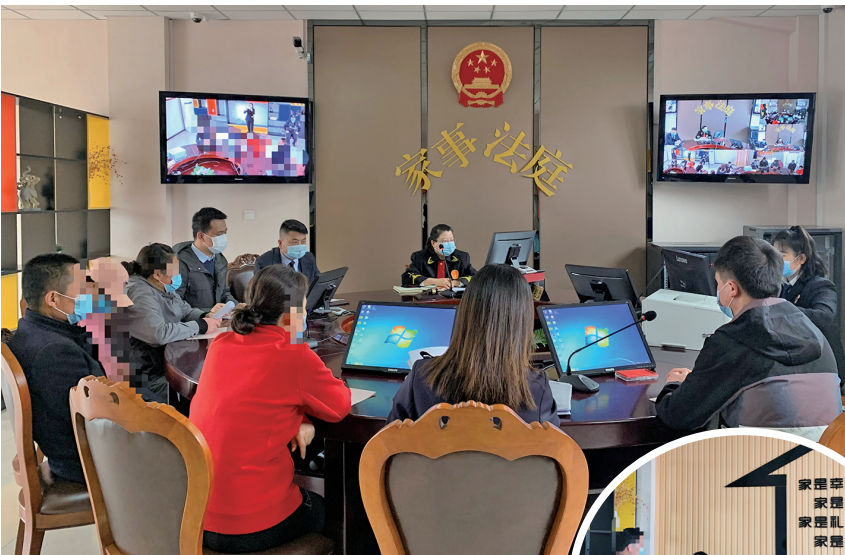
家事审判法庭办理婚姻家庭案件。