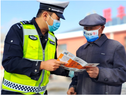
近日,平罗交警在黄梁桥镇向村民讲解交通安全知识。

一”警务机制改革,将宣传触角向农村地区延伸,交警、派出所民警化身交通安全劝导员,农村乡镇干部、交通志愿者、“红通义警”社会力量合力在乡镇、村组开展劝导。组建“红通义警”50余人,累计开展交通安全宣传劝导253次,服务群众1.7万余人次。在农村地区实施“亮尾”行动,针对移民村人员密集、电动车保有量大的特点,重点在庙庙湖、红端、红翔三个移民村开展“亮尾”工作,累计为移民村5400余辆三轮电动车免费张贴反光条,有效降低了农村夜间道路交通事故发生率。