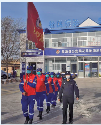
盐池县公安局组织民警巡逻。

车水马龙间,民警指挥车辆有序通行;公园广场上,警灯闪烁护民安;街头巷陌里,民警贴心服务解民忧。每一天,盐池县公安局全警值守,为建设平安盐池保驾护航,以实际行动守护人民群众幸福安康。