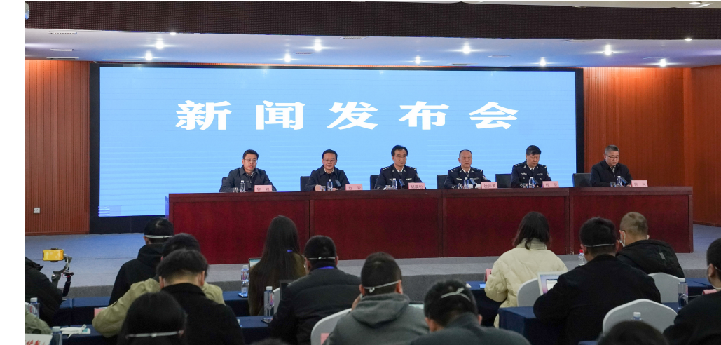
2月2日，江西省、市、县联合工作专班在江西省上饶市铅山县召开新闻发布会，通报胡某宇事件调查情况。