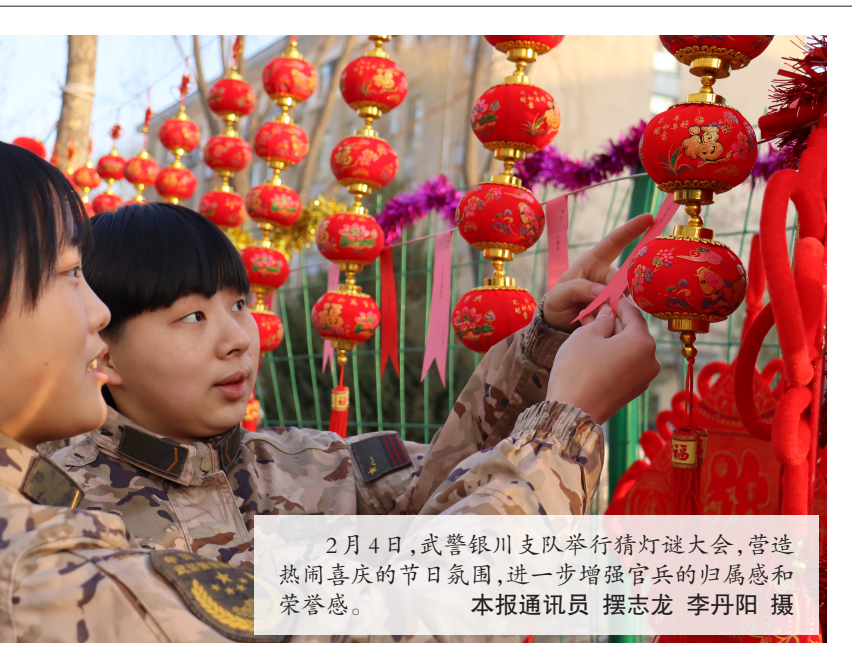
2月4日，武警银川支队举行猜灯谜大会，营造热闹喜庆的节日氛围，进一步增强官兵的归属感和荣誉感。

各类重点群体就业；实施“创业宁夏”行动，通过优化创业环境、强化创业政策支持、完善创业孵化平台、提高创业服务水平等措施，加大自主创业支持力度，提升创业服务水平，激发全社会创业热情和活力，放大创业带动就业倍增效应；实施“技能宁夏”行动，通过组织开展“金蓝领”培育计划、企业新型学徒制培训、重点群体技能培训、推进终身职业技能培训等措施，强化培训就业导向，健全完善职业技能培训体系，加快急需紧缺技术技能人才培养，提升劳动者技能素质，缓解“就业