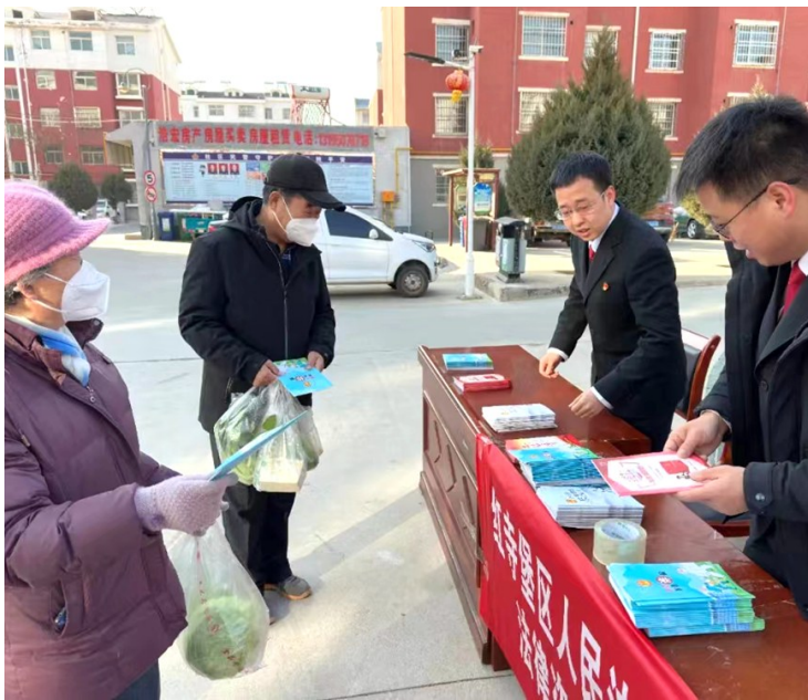
红寺堡法院干警向社区群众讲法、释法。