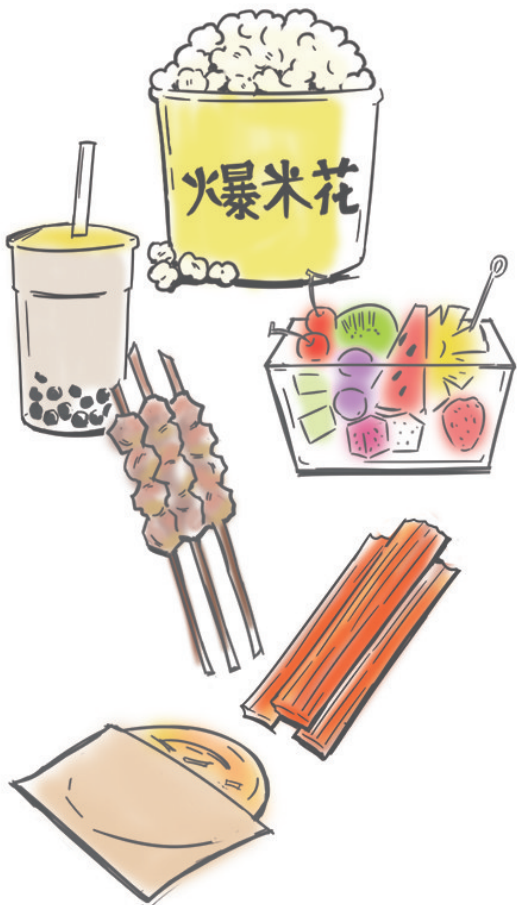
每一道美食都有故事