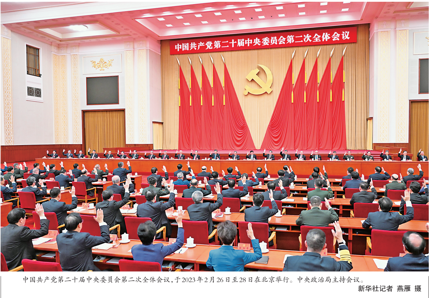
中国共产党第二十届中央委员会第二次全体会议,于2023年2月26日至28日在北京举行。中央政治局主持会议。

新华社北京2月28日电 中国共产党第二十届中央委员会第二次全体会议公报 (2023年2月28日中国共产党第二十届中央委员会第二次全体会议通过) 中国共产党第二十届中央委员会第二次全体会议,于2023年2月26日至28日在北京举行。 出席这次全会的有中央委员203人,候补中央委员170人。中央纪律检查委员会副书记和有关部门负责同志列席会议。 全会由中央政治局主持。中央委员会总书记习近平作了重要讲话。 全会听取和讨论了习近平受中央政治局委托作的工作报告,审议通过了中央政治局在广泛征求党内外意见、反复酝酿协商的基础上提出的拟向十四届全国人大一次会议推荐的国家机构领导人员人选建议名单和拟向全国政协十四届一次会议推荐的全国政协领导人员人选建议名单,决定将这两个建议名单分别向十四届全国人大一次会议主席团和全国政协十四届一次会议主席团推荐。审议通过了在广泛征求意见的基础上提出的《党和国家机构改革方案》。习近平就《党和国家机构改革方案(草案)》向全会作了说明。全会同意把《党和国家机构改革方案》的部分内容按照法定程序提交十四届全国人大一次会议审议。 全会充分肯定党的二十届一中全会以来中央政治局的工作。一致认为,面对严峻复杂的国际环境和艰巨繁重的国内改革发展稳定任务,中央政治局全面贯彻党的二十届一中全会精神,高举中国特色社会主义伟大旗帜,全面贯彻习近平新时代中国特色社会主义思想,坚持稳中求进工作总基调,更好统筹国内国际两个大局,更好统筹疫情防控和经济社会发展,更好统筹发展和安全,兴起学习宣传贯彻党的二十届一中全会精神热潮,隆重悼念江泽民同志,做好全国人大、全国政协换届准备