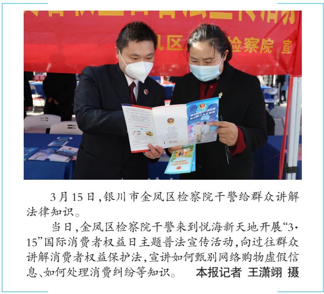
3月15日,银川市金凤区检察院干警给群众讲解法律知识。

个人所带来的沉重代价,告诫干警们不要因贪念滥用权力,葬送美好前途,毁掉幸福家庭,失去自由。 参观结束后,全体干警面向党旗郑重宣誓,声声誓言铿锵有力,句句承诺激发斗志,彰显了检察干警的为民初心。5名党员干警根据自身工作实际,围绕“颂党章,忆初心”廉洁从政主题,现场进行了交流发言。干警们表示,在今后的工作中,将始终坚持做到自省、自省、自重、自律,增强法治意识和廉政意识。