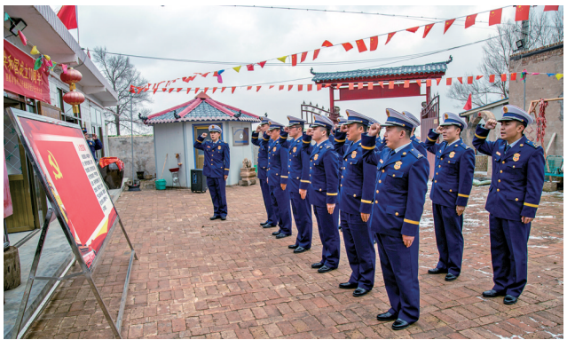
消防官兵在红色文化大院重温入党誓词。