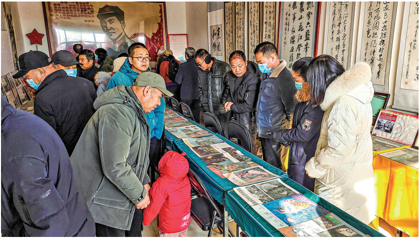
重大节日参观红色文化大院的群众络绎不绝。