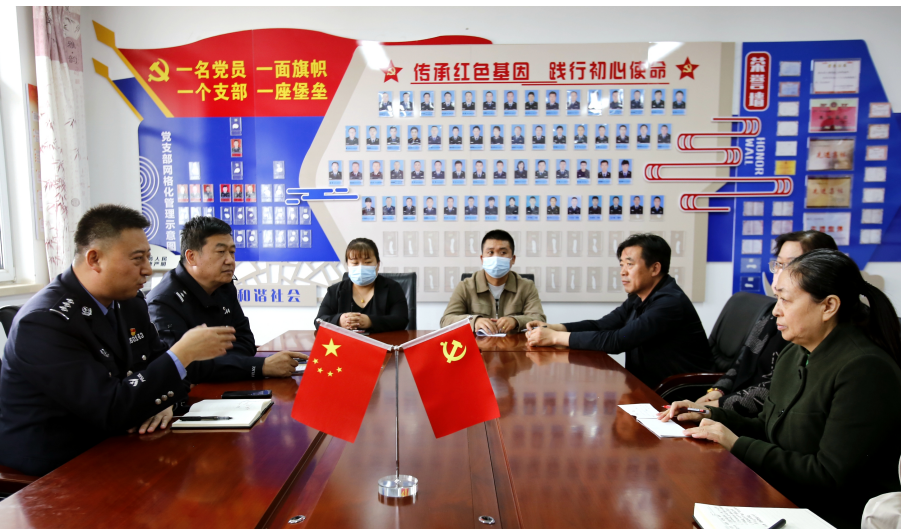
3月21日,盐池县花马池派出所召开辖区住宿行业负责人恳谈会。