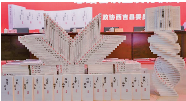
西吉县政协编纂出版《西吉文史资料》(第四辑),该套资料丛书共8本,由中国文史出版社出版。

阅读西吉县政协编纂的《西吉文史资料》丛书(第四辑),沉甸甸的八大本,数百万文字,还有大量图片。这些文字和图片大多数出自亲历亲见亲闻者之手,真实记述了西吉这块雄峻壮美土地在岁月年轮上的丰盈厚积和沐浴时代的阳光而发生的深刻巨变,充沛展现了西吉干部群众饮水思源的情感情怀和阔步向前的豪迈自信。给我的第一印象,这是一套可以郑重交给历史的丰厚故事集。正如书中所收录的宁夏日报记者的一篇报道中所讲:“那些散落在大山深处的村庄,各自深藏着一本厚重的脱贫故事,等待花开的时节说与人听。”这套真实深情的丛书,是摆脱贫困、走向小康、迈进发展新征程的西吉干部群众向党的二十大的这份献礼,他们以亲历亲为、所见所闻的生动鲜活事实,讲述西吉在时代春风里的奋斗与精彩、回思与感念。这套倾注了编纂者心血的丛书,也展现了西吉县举旗帜、展形象、兴文化、存史料和激励当前、昭示未来的踔厉奋发与深谋远虑。