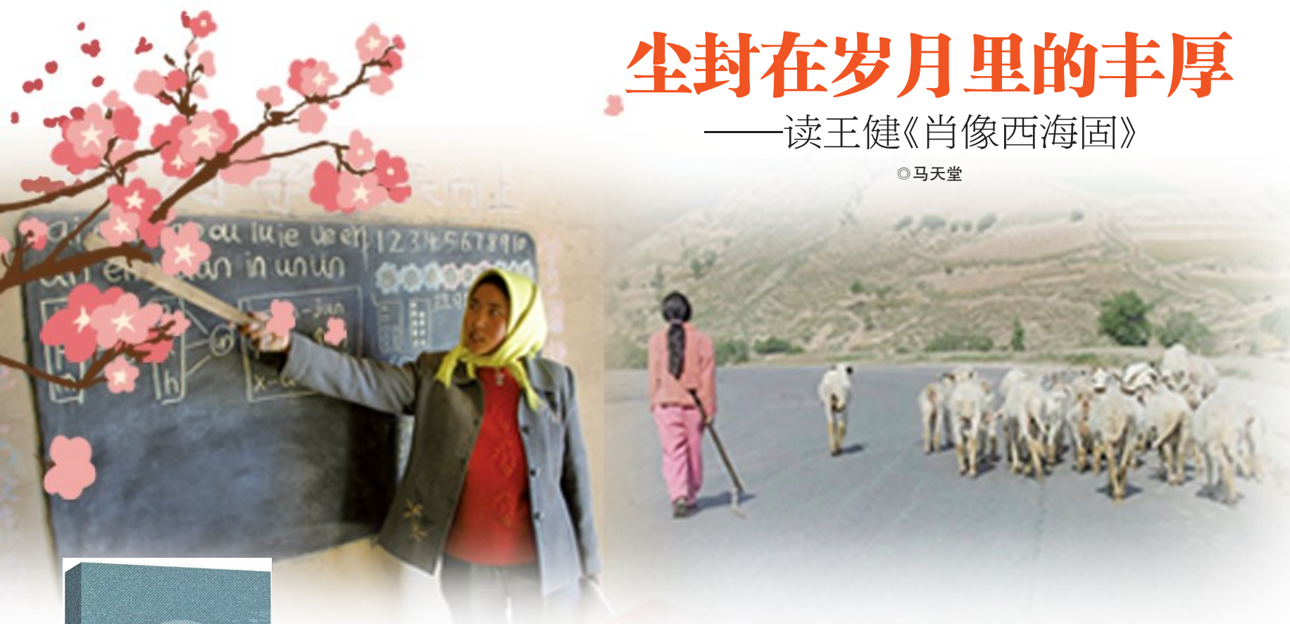
正在上课的山村女教师。

读我们生息土地上的历史,听我们身边人的讲述,不仅能登古知今、学史明智,增进对社会对家乡的信心。而且有如归故里、如话家事的亲切亲近,激发我们对斯土斯民的热爱。最后,我想给主持编纂这套丛书的西吉县政协发心底地点个赞,他们很重视发挥文史资料“存史、资政、团结、育人”的独特作用,将编纂文史资料第四辑作为开局起步的首篇之作,精心谋划、倾力推进,这种为时代立言、为事业立鉴、为家乡存史和自觉服务发展大局的境界、识度和作为令人感动。