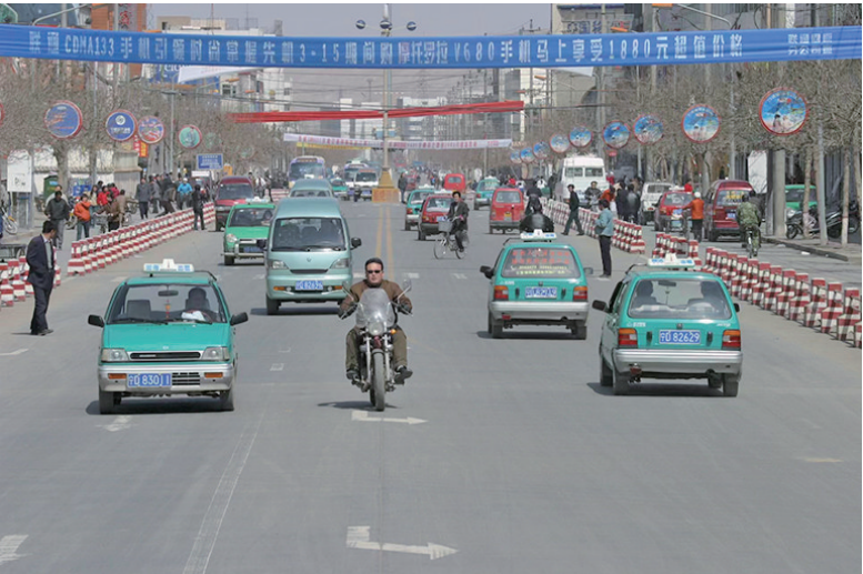
2003年,固原街头的出租车。

流露出的焦虑与窘困。好多人物肖像图让人过目难忘,讲红色故事的长者,忘情吹号的少年,风中接送孩子上学的年轻媳妇,崖畔上好奇打量汽车的孩子,街市上佩戴故旧行头的山里人,古稀年依然靠科技发家的老者。书中还用多幅图片记录群众自发建屋立馆、保护红军长征过境的红色足迹,表现西海固人民吃水不忘挖井人、致富感谢共产党的纯朴感恩情怀,讲述这块土地上的光荣革命历史,不仅引导促进了红色旅游业的发展,而且存留了大量宝贵历史资料。