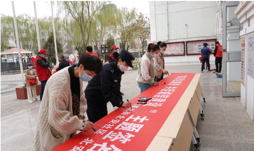
3月24日，银川市兴庆区凤凰北街街道办事处北安社区开展“防范非法集资 共促诚信建设”主题签名活动，社区普法志愿者、民警和居民面对面交流，通过以案释法，使居民了解非法集资的危害。

近年来，银川市检察机关将品牌创建工作列为全年目标任务，创特色、育亮点、铸品牌，将常规工作特色化、特色工作品牌化，形成覆盖党建、“四大检察”、综合业务、行政管理等各方面的“银检品牌”矩阵。推动检察品牌深度融入检察业务，切实将检察品牌建设转化为检察新动能，用实力和成绩打造出银川检察新名片、树立银川检察新品牌。今年，银川市检察机关将以品牌创建为抓手，以特色亮点为驱动，持续创新打造检察品牌，不断推动检察工作新发展。