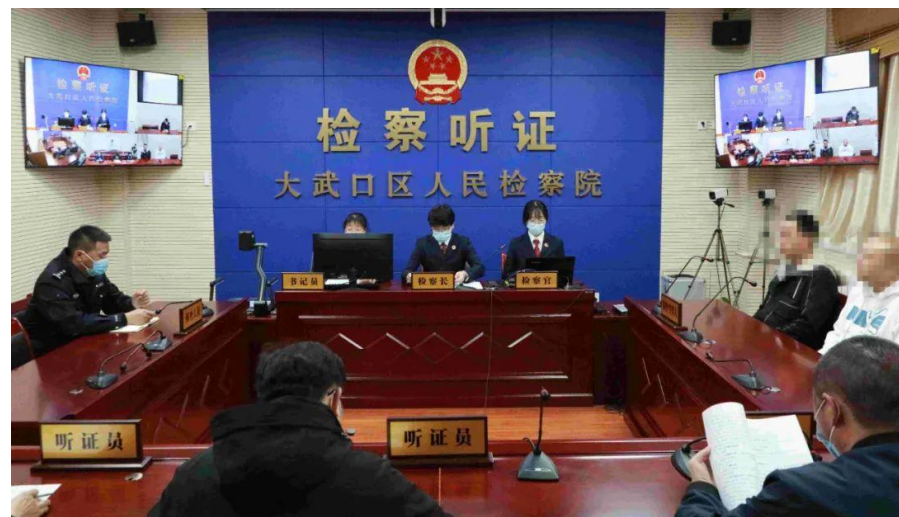
近日,大武口区检察院对一起故意伤害案召开公开听证会。听证员在充分了解案情基础上,对案件进行了评议。

会上,参会人员参观了园区警务室。随后召开的座谈会,解读了该局出台的《加强警企共建全面推行“企业警长”工作的实施意见》《优化营商环境助力企业高质量发展20项措施》,介绍了公安机关优化营商环境工作开展情况。