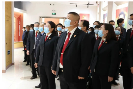
近日,惠农区法院组织中层以上领导干部、员额法官及法官助理等50余人,到自治区廉政警示教育中心参观,接受党性党规党纪教育。