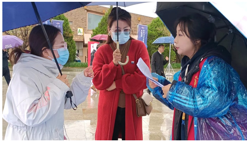
5月9日,沙坡头区司法局工作人员在沙坡头景区,冒着小雨向旅客宣传民法典,并向旅客提问相关知识,答对者赠送小礼品。

沙坡头区检察院在日常检察监督过程中发现,被监督单位在刑罚执行过程中可能存在违反法律规定的行为,调取相关证据材料后,依据刑事诉讼法等相关法律规定,对证据材料进行了严格审查,拟向被监督单位