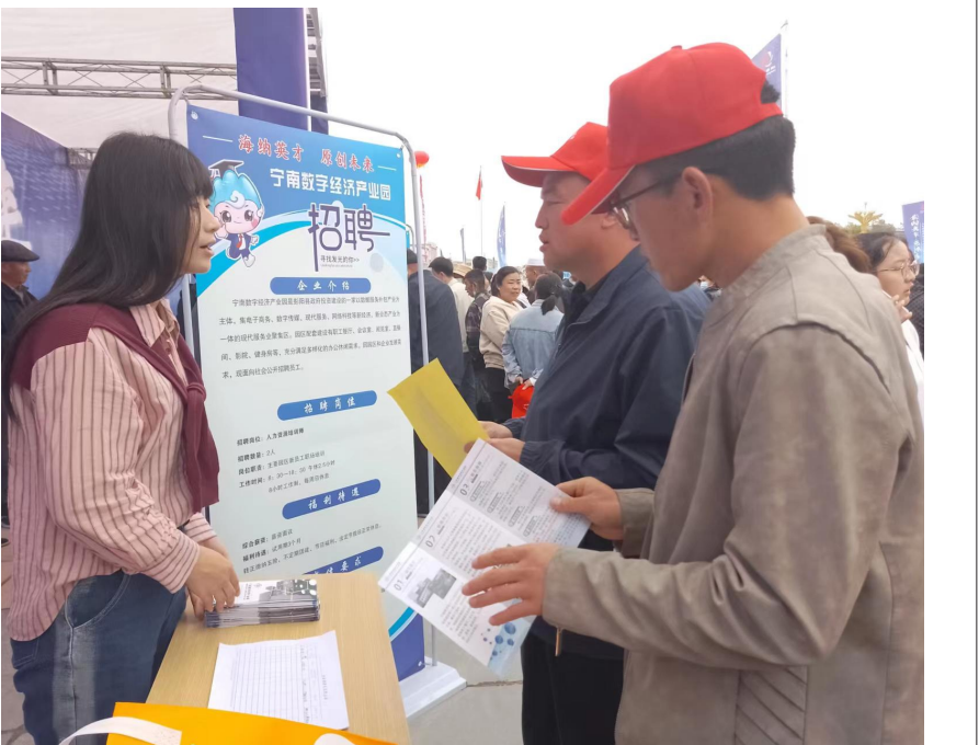
5月29日，海原县举办人才招聘会，来自福建、广东和宁夏区内的49家企业提供4668个就业岗位。其中大学生就业岗位1823个，涉及会计、教师、技术研发、电气自动化等专业；操作性岗位2845个。图为应聘者向用人单位咨询工作要求。

本报讯（记者 翟迎春）5月28日，海原县举办首届“海纳英才·原创未来”人才节暨“我们的历史·我们的城”青年人才实践教育活动。闽宁对口帮扶干部、自治区院校（企业）代表等60余名青年人才参加观摩活动。 观摩团首先来到海原县非物质文化遗产传承基地，先后参观了海原民俗文化、红色文化等展馆，亲身体验了海原“花儿”、剪纸、木雕等非物质文化遗产的魅力。 在海原地震博物馆，观摩团通过聆听讲解、观看有关海原大地震的图片、文字、实物资料等形式，深入了解了地震灾害给海原带来的重大损失，进一步学习了防震减灾相关知识。 在闽宁科技园，观摩团先后参观纺织品加工车间、卡立方公司，详细了解闽宁对口帮扶，促进当地群众就业情况。纺织车间缝纫电机飞转、电脑刺绣车间机器隆隆、卡立方设备有序运行，工人们熟练操作着机器。一件件服装、一幅幅刺绣、一张张智能卡从这里走出海原、走向全国，销往多个国家和地区。海原