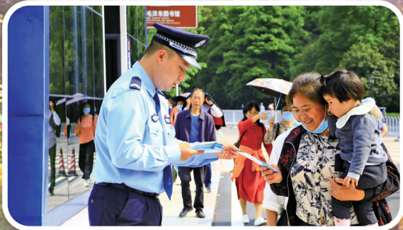
民警向游客发放反诈宣传单。