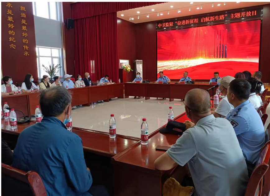
6月14日，中卫监狱举办开放日活动，与参观人员座谈交流。

本报讯（记者 翟迎春 通讯员 王贝利）6月14日，中卫监狱举办“奋进新征程 启航新生路”主题开放日活动。中卫市及中宁县人大代表、政协委员、公检法司机关代表，执法监督员、新闻媒体记者、警察家属、服刑人员家属代表共同走进高墙，通过实地参观、召开座谈会、观看宣传片等形式深入了解中卫监狱各项工作开展情况。 在讲解员的带领下，全体参观人员一边聆听讲解，一边观看工作展板和服刑人员教育改造成果，重点观摩了服刑人员的书法、绘画、手工艺品等文化作品，使参观人员初步对监狱工作有了了解。通过安检，参观人员进入监管区，先后参观了服刑人员监舍、习艺车间、配餐中心等，了解监区整体功能结构、现场管理等情况；在服刑人员监舍，了解了“网格化”管理模式和定置管理要求，现场看到了满足服刑人员日常生活需求的箱包房、浴室、开水房等各种功能房。在后勤监区，大家现场参观配备了各类炊事机械器材的配餐中心，了解了服刑人员一日三餐配置流程和“吃饱、吃熟、吃卫生”的伙食管理标准。参观过程中，服刑人员家属表示：“看到监狱环