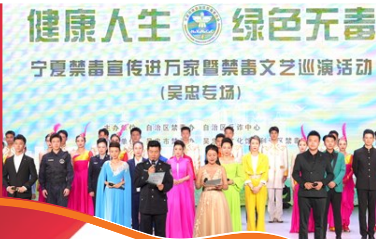
6月16日，全区禁毒宣传进万家暨禁毒、反诈文艺巡演吴忠专场在吴忠市文化馆A剧场圆满落幕。