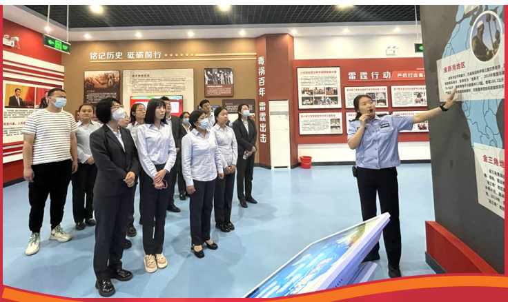
2023年禁毒宣传月期间，吴忠市禁毒办组织全市干部职工，分批到市禁毒教育基地参观，开展禁毒警示教育。