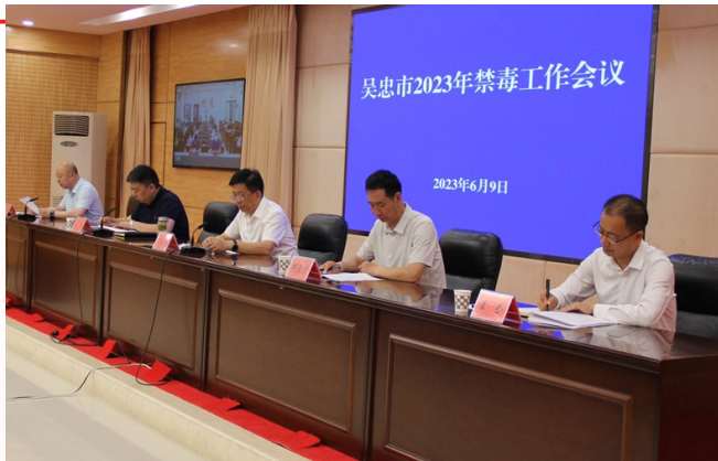
6月9日，吴忠市禁毒委召开全市禁毒工作会议，通报2022年禁毒工作，对抓好2023年禁毒工作作出安排。

四是实体运行强保障。市县两级将禁毒经费纳入财政预算足额保障，全市48个社区戒毒康复中心全部规范达标。市县两级禁毒办实体化运行，按照25:1的标准统一招聘禁毒专干360人，承担禁毒宣传教育、禁吸戒毒等日常任务，推动毒品问题整治从重灾区向示范区嬗变升级。