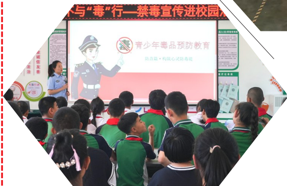
← 6月14日上午，吴忠市禁毒办联合市教育局、市检察院走进吴忠市特殊教育学校，以防范毒品侵害和抵御网络犯罪为主题，为60余名在校学生上了一堂特殊的禁毒法治教育课。