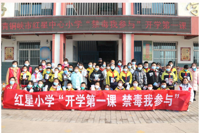
2023年3月，青铜峡市禁毒办组织工作人员，通过“开学第一课”等方式开展禁毒宣传进校园活动。