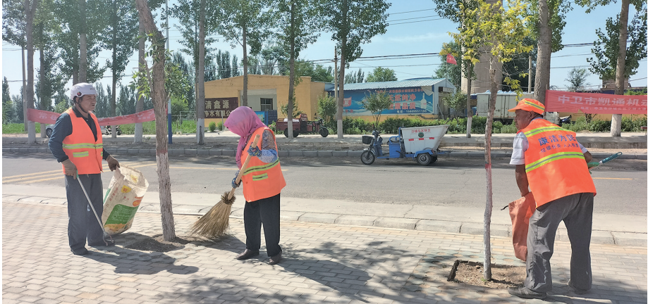
近日，中卫市环卫工人冒着酷暑对街道、集贸市场、城中村街巷、垃圾收运点、交通枢纽周边等开展“大清扫、大清洗、大整治”，营造清洁舒适的生活环境。