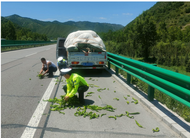
民警帮驾驶员拾掉落落的青辣椒。

本报讯(记者 陈世伟)7月6日14时40分许,自治区公安厅交通管理局高速交警十四大队民警沿青兰高速巡逻时发现,前方一辆行驶中的小货车上不断有青辣椒掉落在行车道和应急车道,且车厢内其余货物随时有可能掉落。