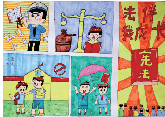
《宪法陪伴我们成长》银川市西夏区第二小学四年级(2)班 赵彤 指导老师 梁超