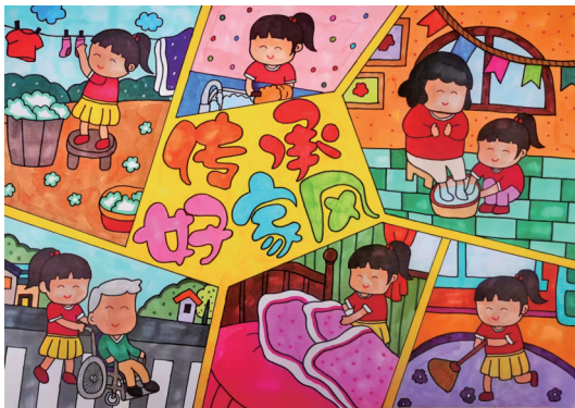
《传承好家风》银川市金凤区第七小学五年级(4)班 金杨朝 指导老师 徐丹 郭影