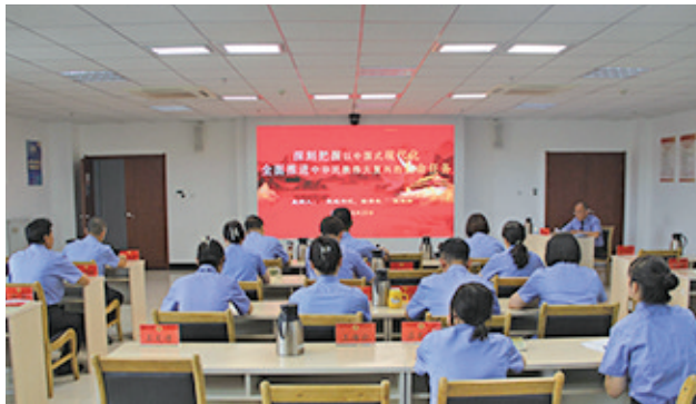
“七一”前,党组书记、检察长张铁轮为干警讲党课。