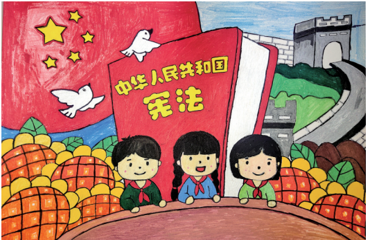
《学习宪法》盐池县第六小学一年级(6)班 侯辰洋 指导老师 杨晓楠