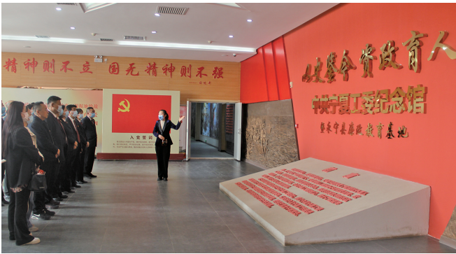
3月23日,上前城检察院组织干警前往宁夏工委纪念馆暨永宁县廉政教育基地参观学习。