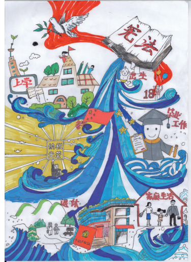
《宪法 为幸福生活护航》吴忠市红寺堡区新庄集中小学五年级(1)班 张欣 指导老师 马宝