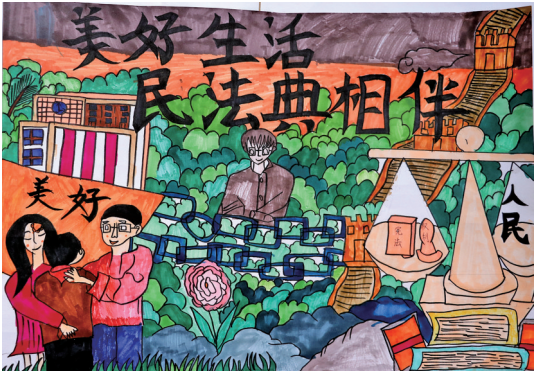
《美好生活 民法典相伴》银川市西夏区第二小学六年级(2)班 李倩倩 指导老师 孙威

由自治区关工委、宁夏法治报社联合举办的“法伴成长——我身边的法治故事”全区青少年主题征文活动启动以来,受到广泛关注,大家积极参与、踊跃投稿,生动讲述身边发生的法治故事,深刻剖白对法治的思考与体悟,真情呼吁全社会尊法学法守法用法。本报选取部分优秀作品陆续刊载,敬请关注。