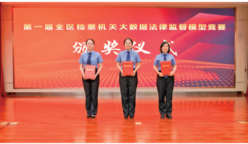
6月,该院大数据监督模型在第一届全区检察机关大数据法律监督模型竞赛中获得二等奖。

认真开展“事交我办请放心、文经我手无差错、案交我办有质效”专项活动,建立“红黄榜+能上能下”机制,推动形成能者上、庸者下、劣者汰的正确导向。上半年晋升检察官和检察官助理4人,遴选员额检察官2人。