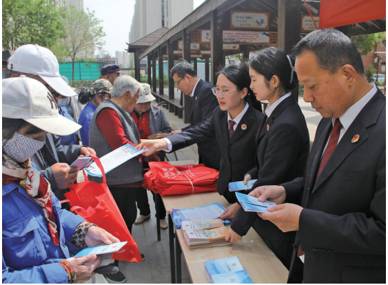
5月6日,干警到金凤区五里台社区开展反诈宣传。

制定《周例会月督查季分析工作制度》《督查督办工作实施细则》,加强对干警的日常监督管理,确保履责责任到位、法律监督到位,为现代化银川建设提供坚强保证。