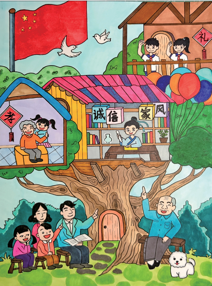
《诚信家风》银川市金凤区第七小学四年级(3)班 马锦轩 指导老师 徐丹 郭影