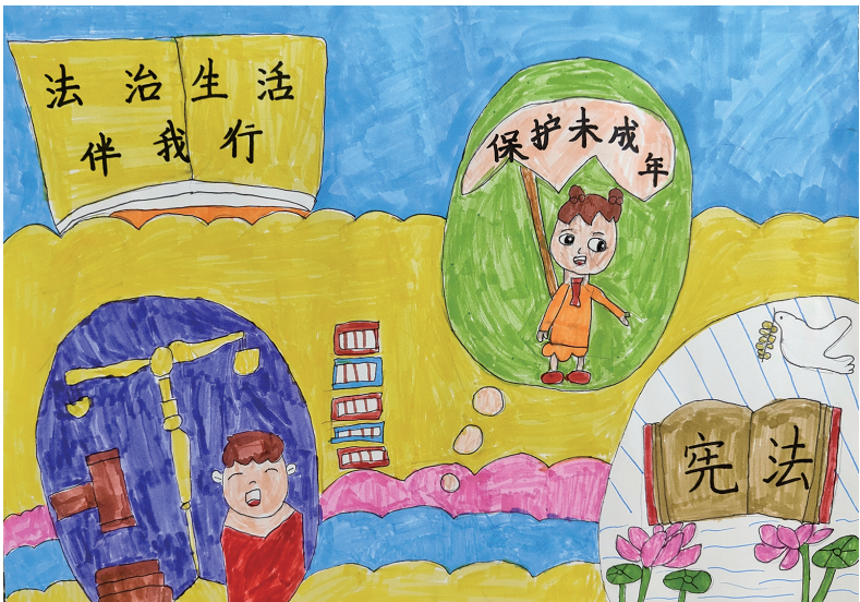
《法治生活伴我行》 银川市金凤区第七小学二年级(3)班 冯弈萱 指导老师 徐丹 郭影