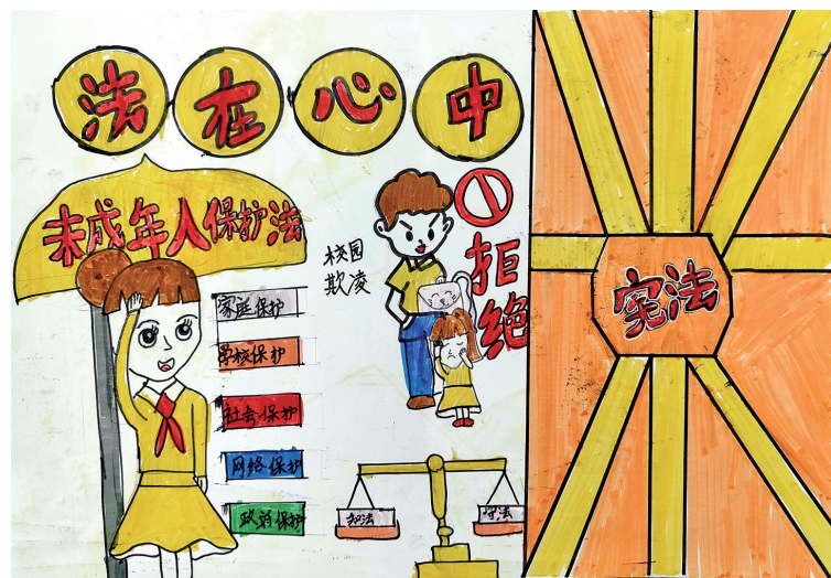
《法在心中》 银川市金凤区第七小学二年级(2)班 陆诗颖 指导老师 徐丹 郭影