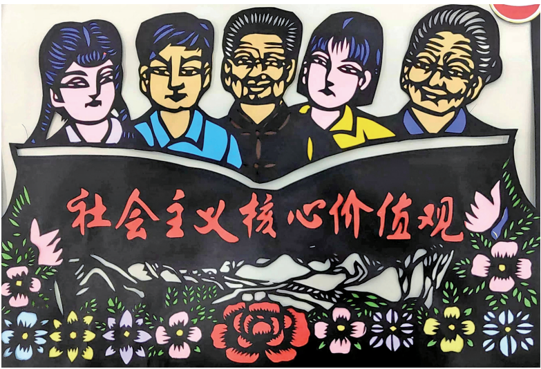
《社会主义核心价值观》 银川市金凤区第七小学五年级(4)班 王玉琴 指导老师 徐丹 郭影