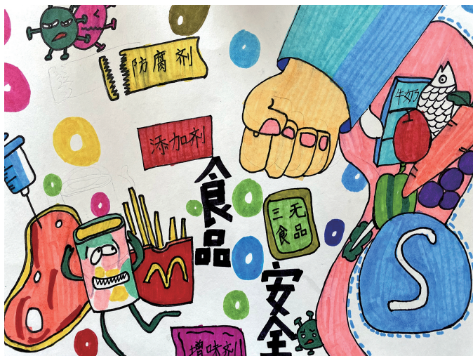
《重拳出击 保障食品安全》 青铜峡市陈青滩中心小学六年级(1)班 白玉龙 指导老师 李斯敏 乔静