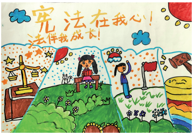
《宪法在我心》 银川市金凤区第七小学二年级(3)班 樊灵茜 指导老师 徐丹 郭影

由自治区关工委、宁夏法治报社联合举办的“法伴成长——我身边的法治故事”全区青少年主题征文活动启动以来,受到广泛关注,大家积极参与、踊跃投稿,生动讲述身边发生的法治故事,深刻剖白对法治的思考与体悟,真情呼吁全社会尊法学法守法用法。本报选取部分优秀作品陆续刊载,敬请关注。