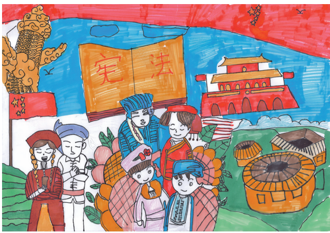
《全民守法》 吴忠市红寺堡区新庄集中心小学六年级(2)班 马兵 指导老师 马宝