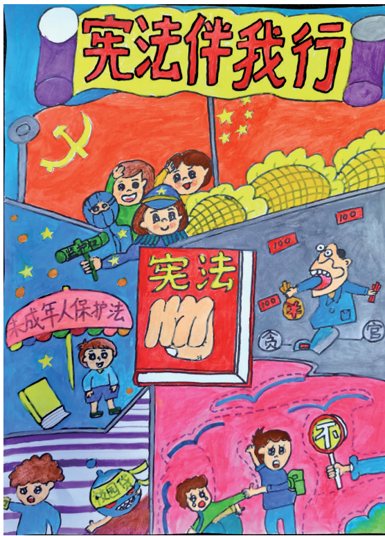
《宪法伴我行》 盐池县第六小学五年级(3)班 杨朔