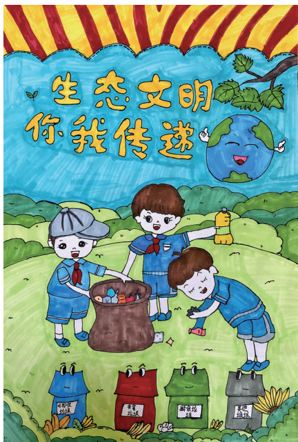
《生态文明 你我传递》 青铜峡市第七中学七年级(1)班 乔雪静 指导老师 李斯敏 乔静