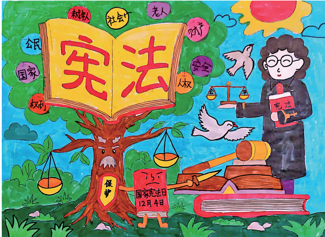
《宪法守护一生》 吴忠市红寺堡区红海小学四年级(2)班 徐伟鑫 指导老师 邵莉娟