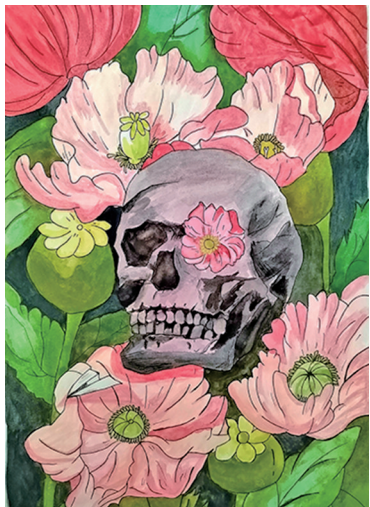
《致命诱惑》 青铜峡市第一幼儿园 李斯敏