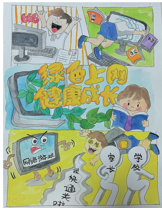
《绿色上网 健康生活》 青铜峡市第六小学五年级(1)班 何佳雯 指导老师 李斯敏 乔静