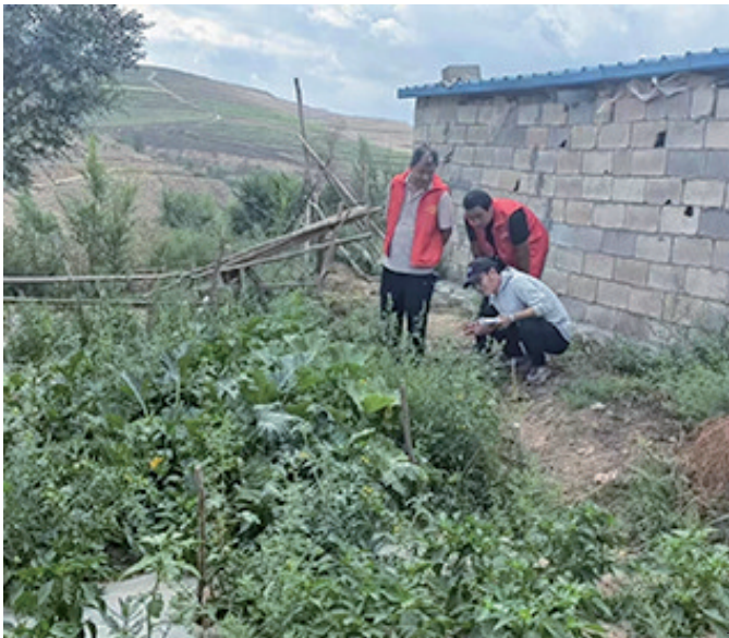
8月8日，西吉县兴平乡政府工作人员、村组干部深入辖区开展禁种铲毒踏查工作。按照“不漏一地、不漏一户、不漏一人”的要求，对辖区空宅、小菜地、废弃厂房等重要区域开展“拉网式”“地毯式”排查，从源头上防止发生种植毒品原植物的违法犯罪行为。

外。当晚明某喂牛时，发现一头怀犊母牛掉落在检查井中。明某想将母牛拉上来，奈何人力有限，母牛被井壁卡住，无法将其拉上地面，只好向警方求助。 此时已是深夜，母牛陷在井中姿势扭曲且长时间未进食，体力流失严重。加上连日大雨，水井及周边土地变得松软湿滑，母牛体力不支，配合度不高，给救援带来极大阻力。 处警人员利用铁锹等工具，一点一点在检查井周边挖出一条缓坡。为防止工具伤到母牛，在靠近井壁的一侧，处警人员放下工具，直接用手疏通泥土。最后，大家一起用绳子将母牛从井中拉出。