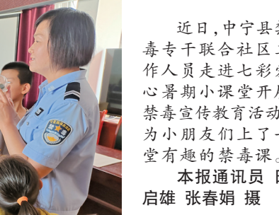
近日,中宁县禁毒专干联合社区工作人员走进七彩爱心暑期小课堂开展禁毒宣传教育活动,为小朋友们上了一堂有趣的禁毒课。

本报讯 (通讯员 米兰) 8月16日,中卫监狱举办燃气、交通安全培训班,全体警察职工参加培训。 在燃气安全管理能力提升培训中,中石油昆仑燃气有限公司中卫分公司创新工作室负责人从燃气事故案例、燃气基本知识、常见燃气设备、燃气使用的不规范行为、燃气使用安全规范等方面,引导警察职工深入学习燃气安全知识,熟练掌握使用规范,切实提高应急处置能力。 结合中卫监狱警察通勤实际,培训