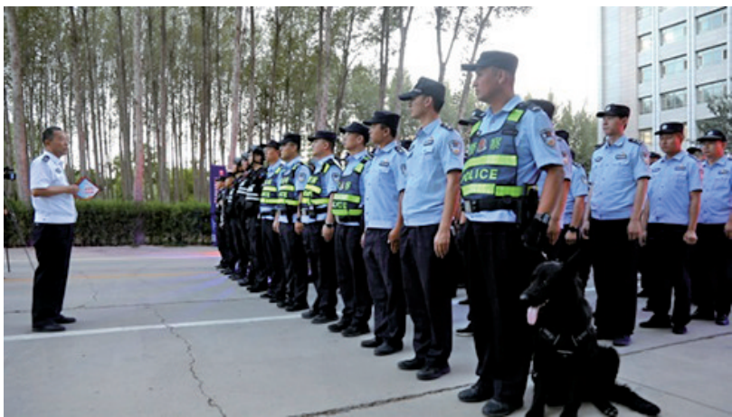
近日,中卫市公安局民警出警前安排当日工作任务。

同时,聚焦社会治安重点地区和突出问题,对商城、酒店、宾馆、酒吧、KTV、“九小”场所等人员密集、治安复杂区域、重点行业场所集中开展地毯式、拉网式、滚动式清查检查,最大限度消除治安隐患和盲点,切实将各类隐患消除在萌芽状态。健全“1、3、5分钟”快速响应机制,加强城乡接合部、娱乐场所、旅店、洗浴等治安复杂场所排查整治,抓好医院、机场、车站、商业中心、旅游景区等人员密集场所治安防控,及时清除安全隐患。