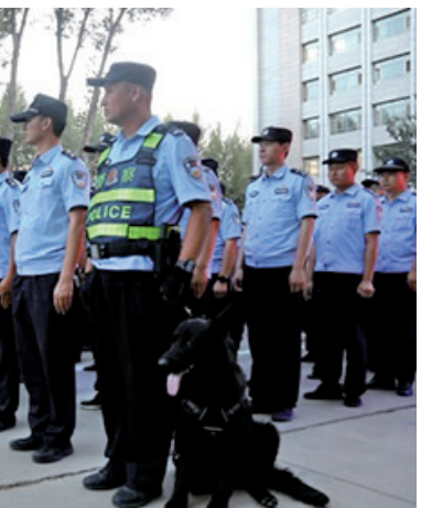
近日,中卫市公安局民警出警前安排当日工作任务。

同时,聚焦社会治安重点地区和突出问题,对商城、酒店、宾馆、酒吧、KTV、“九小”场所等人员密集、治安复杂区域、重点行业场所集中开展地毯式、拉网式、滚动式清查检查,最大限度消除治安隐患和盲点,切实将各类隐患消除在萌芽状态。健全“1、3、5分钟”快速响应机制,加强城乡接合部、娱乐场所、旅店、洗浴等治安复杂场所排查整治,抓好医院、机场、车站、商业中心、旅游景区等人员密集场所治安防控,及时清除安全隐患。