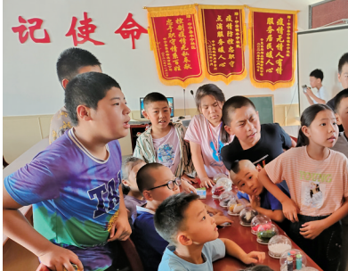
近日,中宁县禁毒专干联合社区工作人员走进七彩爱心暑期小课堂开展禁毒宣传教育活动,为小朋友们上了一堂有趣的禁毒课。

本报讯 (通讯员 田军) 8月15日,中宁县检察院邀请县消防救援大队教员开展消防安全知识培训,进一步增强干警消防安全意识和安全防火能力,提高消防应急处理和快速反应能力,切实筑牢消防安全“防火墙”。 消防培训教员结合近几年身边典型火灾案例、生活中存在的安全隐患,分析了火灾事故起因,讲解了火灾逃生、自救、火灾紧急情况处置和火灾应急疏散常识等内容,引导检察干警积极