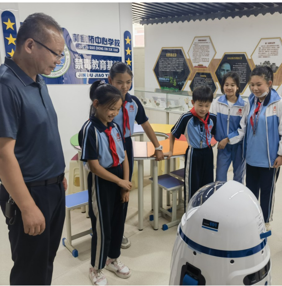
9月13日，吴忠市禁毒办向辖区万达商业广场、利通区郭家桥中学投放两台机器人“禁毒公益宣传员”，为群众和学生提供禁毒知识咨询服务。

认罚相关问题以及规范化量刑四个角度出发，围绕以审判为中心的刑事诉讼制度改革，结合真实案例进行了深刻阐述。同时向大家分享了刑事审判工作中的三点心得体会：常思肩负之责；常怀敬畏之心；常念群众之盼，以实际行动诠释司法为民理念。