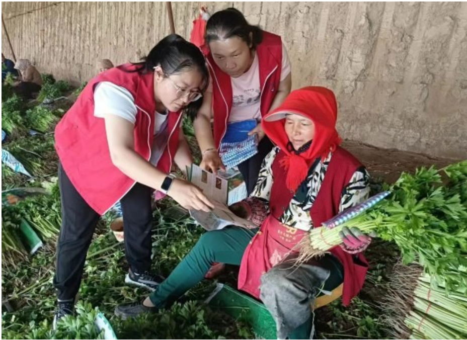
近日，青铜峡市大坝镇人民调解员在巡棚里为种植户讲解法律常识。