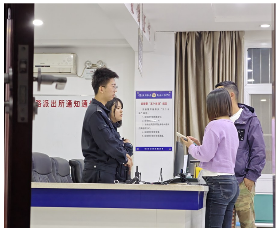
朔方路派出所民警接待报警群众。