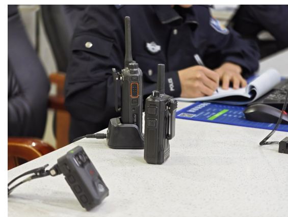
对讲机、执法记录仪就在手边，方便随时出警。