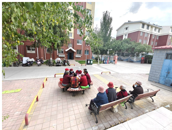
辖区老人一边休息，一边收听广播节目。