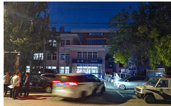
夜间，警车不停穿梭在报警点与派出所之间。