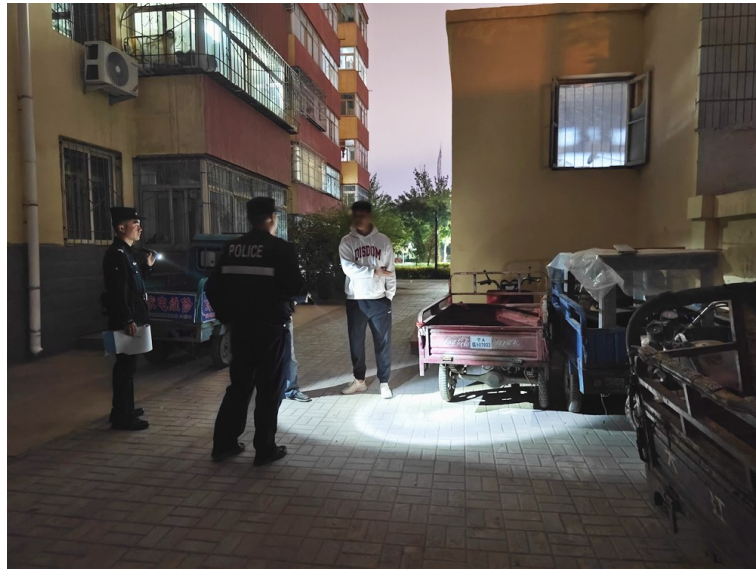
民警打着手电替报案人找回丢失车辆。