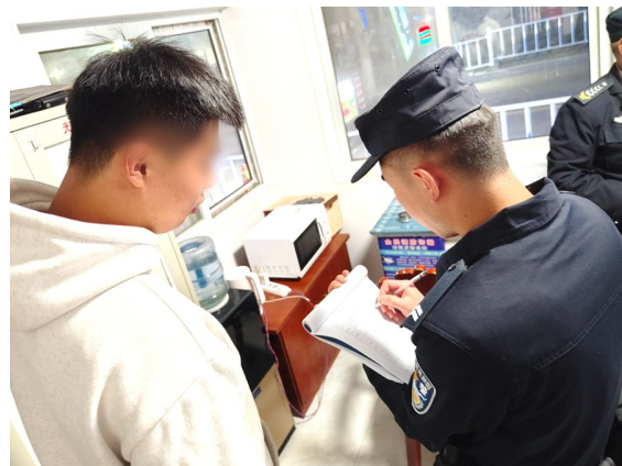
接到车辆丢失报警，民警和报案人核对信息。

“朔方路派出所建于上世纪80年代，辖区覆盖14.7平方公里，属于西夏区核心地段。”该所所长刘永告诉记者，派出所辖区内有远近闻名的“怀远夜市”，以此为中心又构成了怀远商圈，同时，还有宁夏大学、北方民族大学等多所高校，人员密度高。每到夜晚，所里的治安压力较大，民警辅警每天的工作常态就是打击违法犯罪、受理群众报警求助、处置突发事件等，工作琐碎、繁忙。但该所全体民警辅警克服重重困难，通过暖心、及时的服务守护着辖区安全，换来百姓平安。