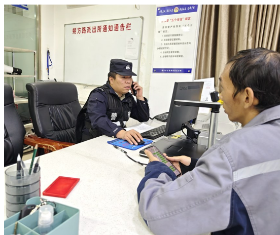
接待辖区居民报警的同时，又有警情需要接听。