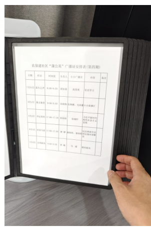
每天都有精彩内容。