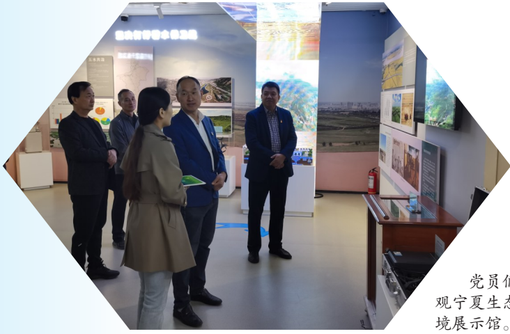
党员们参观宁夏生态环境展示馆。