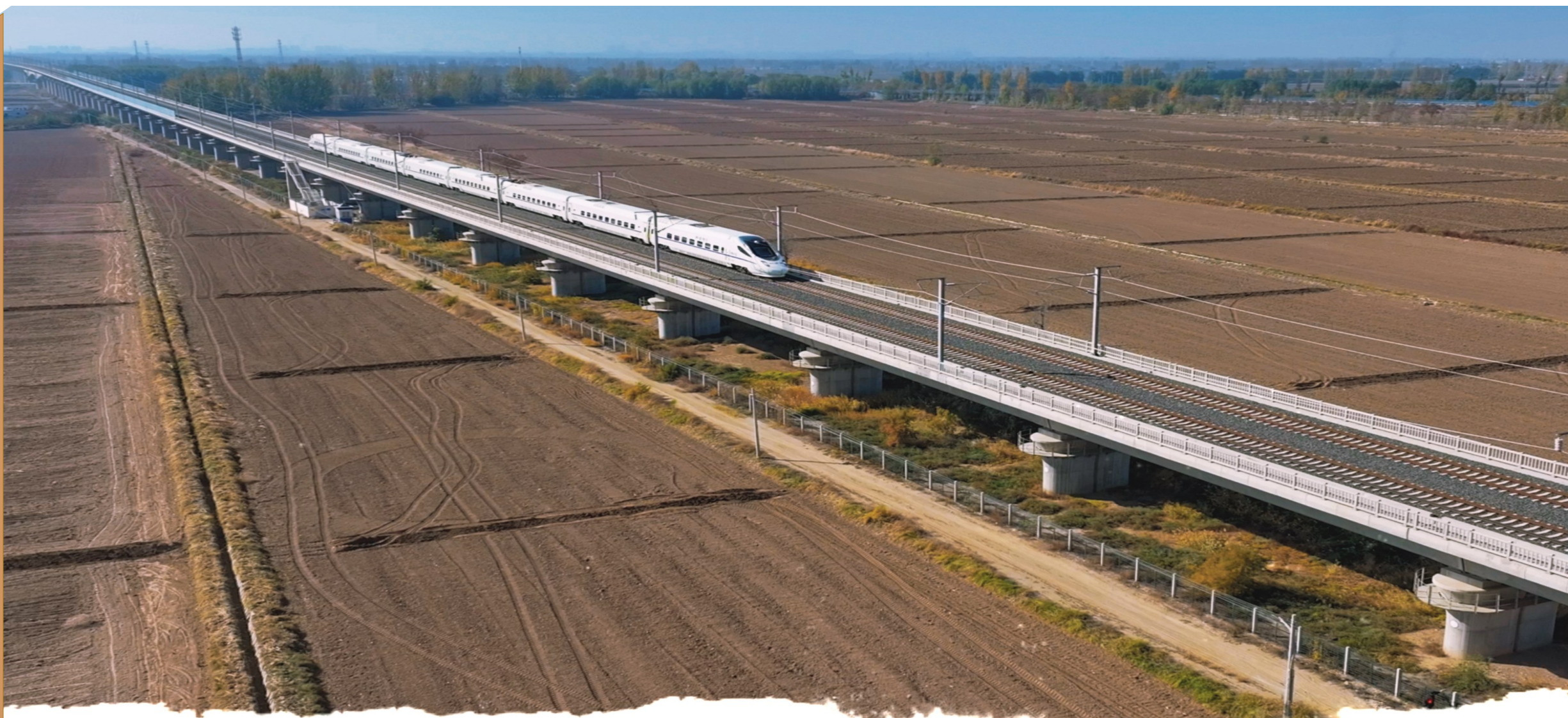
高铁即将进入灵武北站。