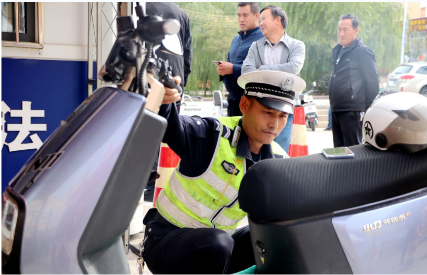
近日,中宁交警利用午休时间集中为群众办理电动自行车挂牌业务。

“截至今年9月底,全区机动车保有量达226万辆,机动车驾驶人272.6万人。今年前三季度新注册登记汽车11万辆,同比增长17.5%。”11月22日,自治区公安厅交管局相关负责人介绍说,面对道路交通发展的新形势、群众出行的新需求,各地公安交管以问题为导向,围绕群众反映强烈的城市道路拥堵点和拥堵