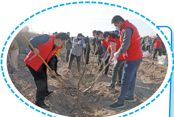
石嘴山市检察院组织干警在贺兰山包片义务植树点参加义务植树活动。

石嘴山市检察院在全区首家推出“公益随手拍”微信小程序，鼓励和支持群众参与生态环境保护公益诉讼线索举报。针对城市不当排涝影响星海湖西水质问题，通过“磋商+检察建议”方式推动问题得到有效整改，该案由自治区检察院生态检察助力建设黄河流域生态保护和高质量发展先行区