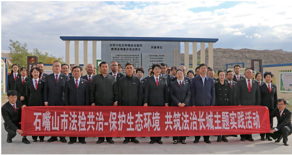
10月19日，石嘴山市中级人民法院与石嘴山市检察院在贺兰山(大磴沟)生态环境法治宣传教育及修复示范点，共同举办“法检共治—保护生态环境 共筑法治长城”主题实践活动。

察、司法行政及生态环境保护等部门，形成生态环境执法司法保护合力，织密织牢生态环境保护网，努力用环境改善的“含绿量”提升民生改善的“含金量”。