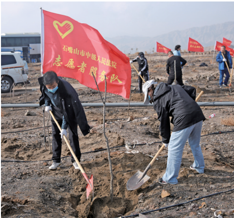
石嘴山中院组织干警在贺兰山包片义务植树点参加义务植树活动。

石嘴山市两级法院积极主动发挥司法职能作用，牢牢把握“公正与效率”主题，切实以法治力量助力全市生态立市和产业转型示范市建设，努力践行“始终坚持用最严格制度最严密法治保护生态环境”的要求，充分发挥司法审判职能作用，依法审理好涉自然资源保护、开发利用等案件，与公安、检