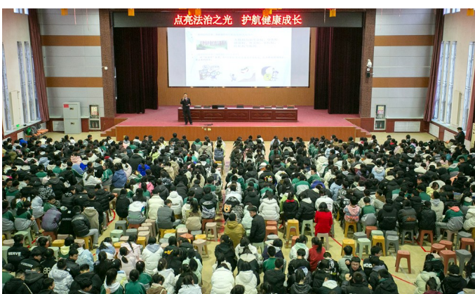
近千人参加法治课堂。