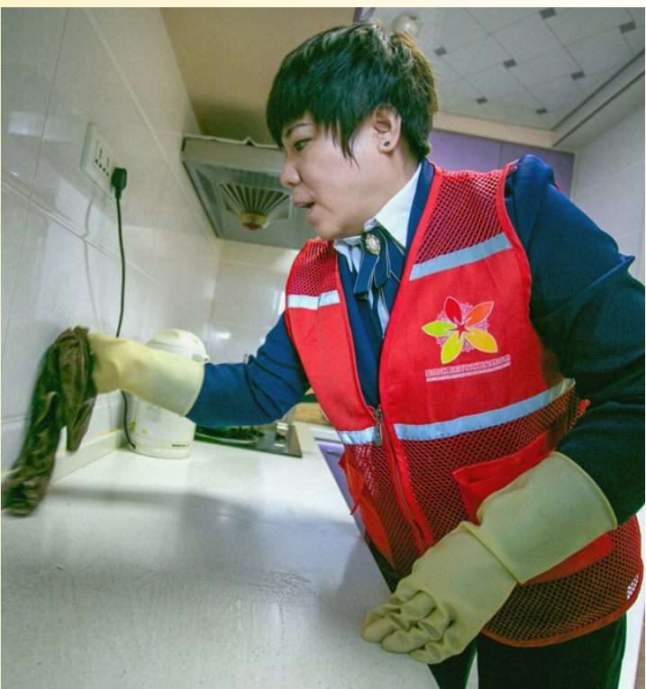
志愿者为老人打扫厨房卫生。