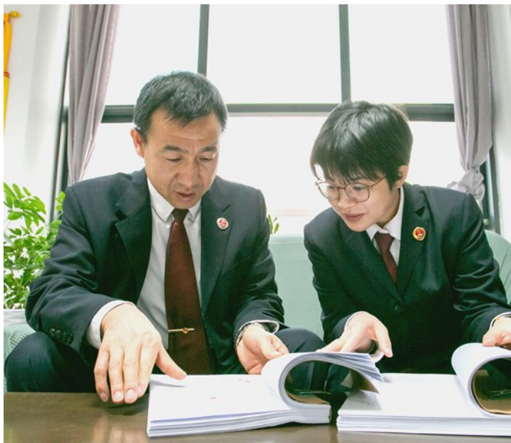
永宁县检察院未检团队查看卷宗。