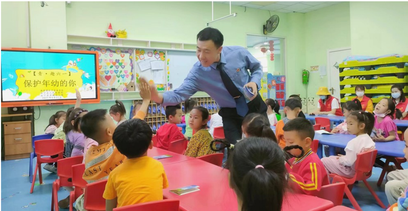
走进幼儿园与孩子互动,种下法治种子。

据了解,永宁县人民检察院在推进法治副校长工作中,结合检察院在办理未成年人刑事检察、民事检察、行政检察、公益诉讼检察工作中发现的具体情况,结合辖区闽宁镇移民聚集,望远镇外来务工人员多子女、流动性大,家长对孩子的家庭教育缺失、法治意识不强等问题精准施教,依法集中统一履行刑事、民事、行政、公益诉讼检察职能,努力把检察司法保护做实,促进家庭、学校、社会、网络、政府、司法“六大保护”走深走实,扎实推进未成年人检察工作现代化,有力服务保障未成年人安全健康成长。