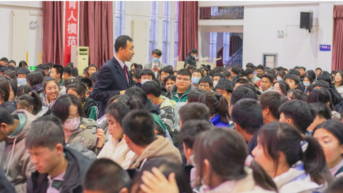
法治副校长现场与学生进行互动。