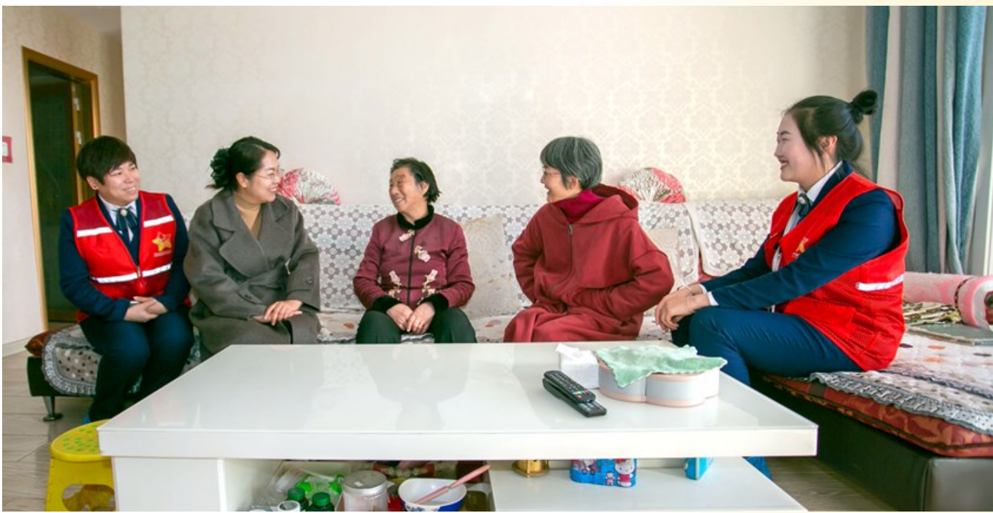
志愿者和老人拉家常。