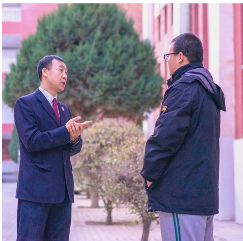
法治课后,学生向法治副校长咨询法律问题。