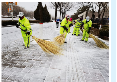
12月14日，银川市投入除雪作业环卫工人4656人，出动大型雪滚车35台、小型雪滚车53台，小型撒布机6台、大型撒布机5台，在市区道路实施清雪作业。