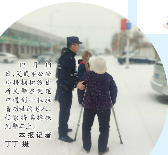
12月14日，灵武市公安局梧桐树派出所民警在巡逻中遇到一位拉着拐杖的老人，赶紧将其搀扶到警车上。

（上接01版）据上海等地的工作思路，首先要在域内选取试点城市，按全领域、全业务类别“全程网办”总体目标，推动“网络实人认证+证照免于提交+补充资料邮寄”工作模式运用，后续全区域落地，最后推广至全国各地。 在日前召开的深化长三角区域不动产登记一体化“跨省通办”改革工作座谈会上，自然资源部表示，下一步将深化改革成果，推动不动产登记从“网上可办”向“网上好办”“全程网办”转变，加快实现长三角不动产登记全业务类型、全区域覆盖一体化“跨省通办”，并将经验做法向京津冀、成渝等区域推广，逐步实现全国重点区域全覆盖。