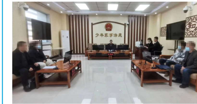
少年家事法庭法官审理案件。

下一步，惠农区法院将深入贯彻落实习近平法治思想，力争做到每一个案件都是生动的普法教材，每一次办案过程都是对社会主义核心价值观的生动诠释，以看得见的公平正义使百姓对法律理解更深刻，真正发挥“审理一起案、教育一群人、讲解一堂法治课、受益一方老百姓”的普法作用，充分依托人民法院推进少年家事法庭建设，及时调配审判力量，实现涉少年家事案件集中审理，为维护未成年人合法权益构筑坚固的司法防线。