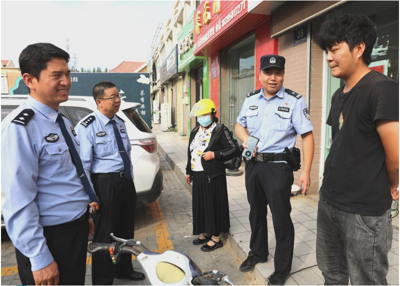
贺兰县公安局法制大队开展日常警情巡查回访,以“小切口”实现执法管理“大效能”。