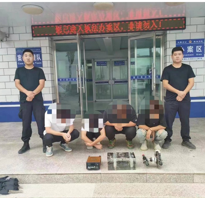
贺兰县公安局刑警大队民警抓获偷盗电动车电瓶犯罪嫌疑人。