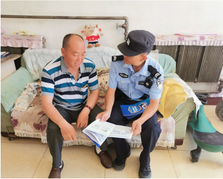
暖泉派出所民警入户开展反诈宣传。