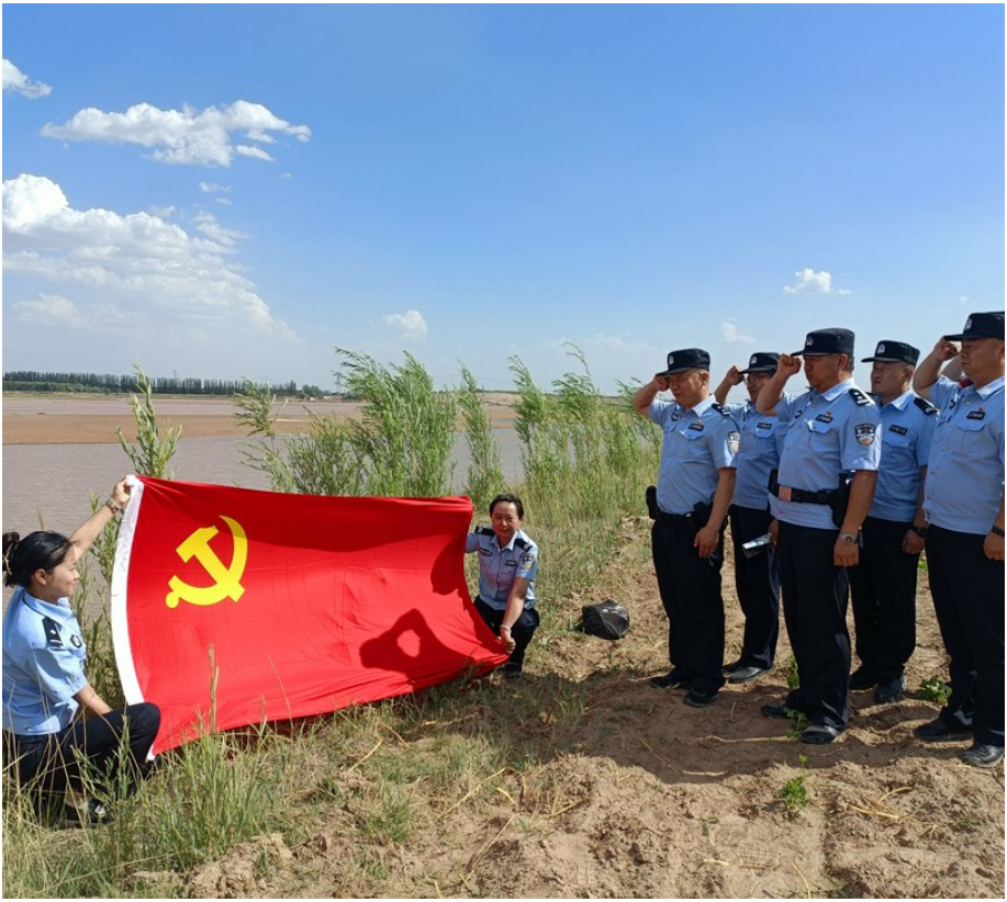
立岗派出所坚持党建引领,积极创建“枫桥式派出所”。图为今年7月,该所民警辅警面对党旗重温入党誓词。

此次闪电破案,得益于贺兰公安坚持“屯警街面、动中备勤、巡中接警、整体联动”的实践。为推动指令直达路面、出警路面出发、支援途中实现,确保警务运行更快一秒、警民关系更进一步,贺兰公安严格落实“1、3、5分钟”快速响应机制,采取“科技+人力、步巡+车巡”相结合的方式,交通要道治安卡口、重点区域街面警务室“守点”,特巡警大队、分局机关巡逻组“控线”,各派出所巡逻组“稳面”,义警、社区巡防队、校园巡防保安等群防群治力量“织网”,立体化、多维度守护辖区社会治安秩序持续稳定。