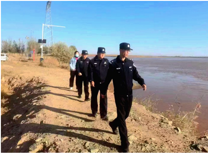
贺兰公安紧紧围绕服务黄河流域生态保护和高质量发展先行区建设,联动联控守护生态安全,齐心协力共筑西部绿色屏障。图为立岗派出所河湖警长在黄河沿岸巡查。