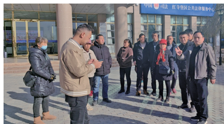
矛盾纠纷调解现场。

今年以来,红寺堡区综治中心坚持治在基层、干在一线,突出实用导向,创新探索“走进中心一扇门,引导在N个进驻窗口受理,指令到N个行业部门督办调处,最后中心‘吹哨’变上访为下访,‘一揽子’化解实现‘事心双调’”的“1+N+N+1=0”运行模式,切实做到矛盾纠纷在基层实质性化解。