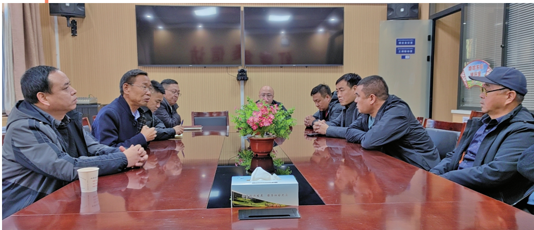
红寺堡区综治中心“吹哨”召集相关行业部门,研究化解某建筑工地拖欠工程款问题。

红寺堡区把综治中心建设放在推进市域社会治理现代化试点的首位,突出“实体、实用、实效、实战”,经过多年实践,初步形成了“一个中心”凝聚各方合力、“一站式”化解矛盾纠纷、“一张网”管理人地事物、“一扇门”内做好基层治理的工作机制,推动基层矛盾纠纷一站式受理、一体化调处、一揽子解决,让群众只进一扇门、了却百家忧,切实把矛盾化解在基层、解决在萌芽状态。