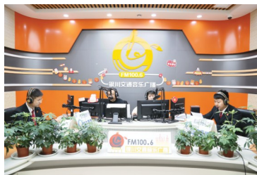
兴庆区法院矛调中心“共享法庭”法治指导员走进银川交通音乐广播直播间,开展普法宣传。