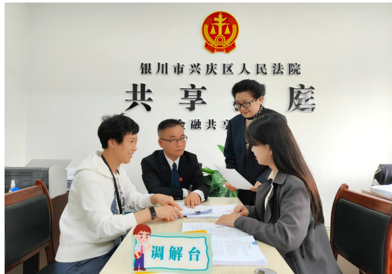
兴庆区法院金融“共享法庭”法治指导员(左二)指导调解员调解案件。

“对银行而言,可以更好地通过法律手段保障信贷资产安全,把银行信用管理有效纳入法治轨道,实现依法信贷。从当事人角度,集中审理降低了诉讼的成本,也大大调动了银行的积极性,通过批量诉讼引导当事人规范诉讼。”原告银行诉讼代理人表示,参与金融纠纷批量化解后不由地感慨。