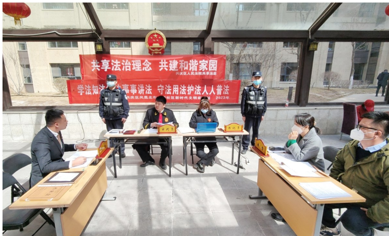
兴庆区法院矛调中心“共享法庭”走进社区开庭审理物业纠纷,示范一案,解答一片。

今年3月,某楼盘业主500余人因开发商无法交付合格的房屋,且未能及时退款而集体信访。针对这一群体性信访案件,矛调中心“共享