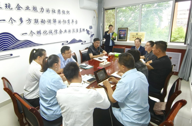
兴庆区法院商事“共享法庭”法治指导员参与诉前调解。

接到案件后,兴庆区法院商事“共享法庭”法治指导员当天组织审判团队,与宁夏企业协会商事调解员联合开展前期调解工作,并与调解员一起协助各方整理付款金额、付款时间、违约责任等,拟制调解协议,得到各方企业的认可。次日,法庭依据此前拟制的调解方案,向各方企业制作了“调解协议书”“调解笔录”,并出具了诉前调确法律文书。至此,该起涉及5家企业标的额达2.5亿元的纠纷在48小时之内得到圆满化解。