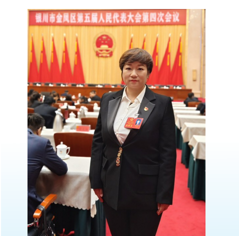
银川市金凤区第五屆人民代表大会第四次会议