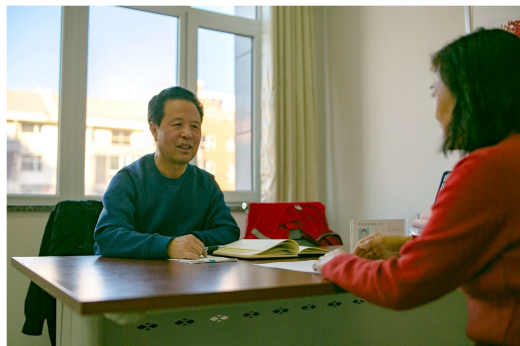
退休法官王拜耐心解答群众咨询的法律问题。