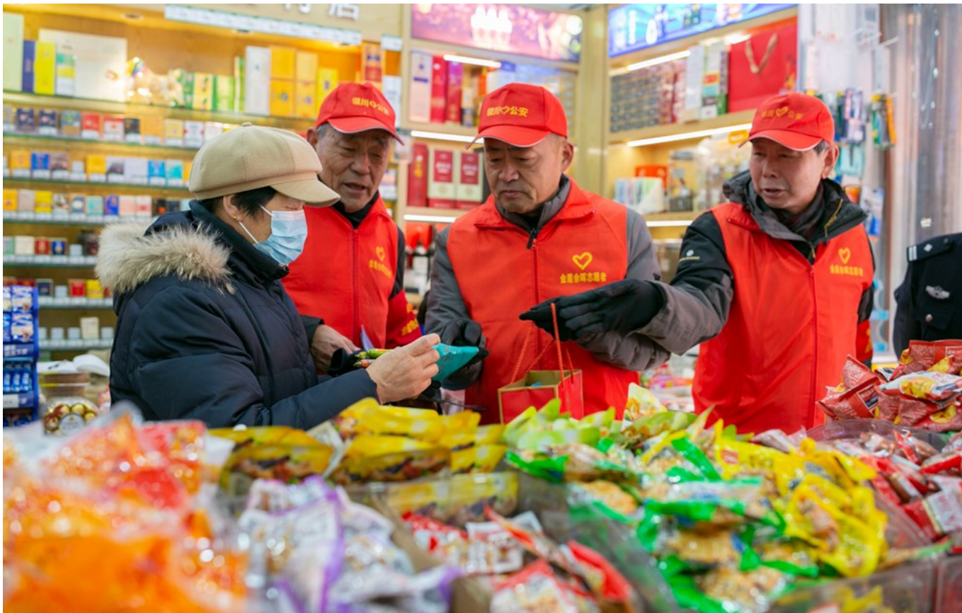
“金盾余晖”志愿者在超市对群众开展反诈宣传。

他们曾经是守护平安的政法干警，退休后仍然“到岗”发挥余热，为辖区平安建设添砖加瓦。