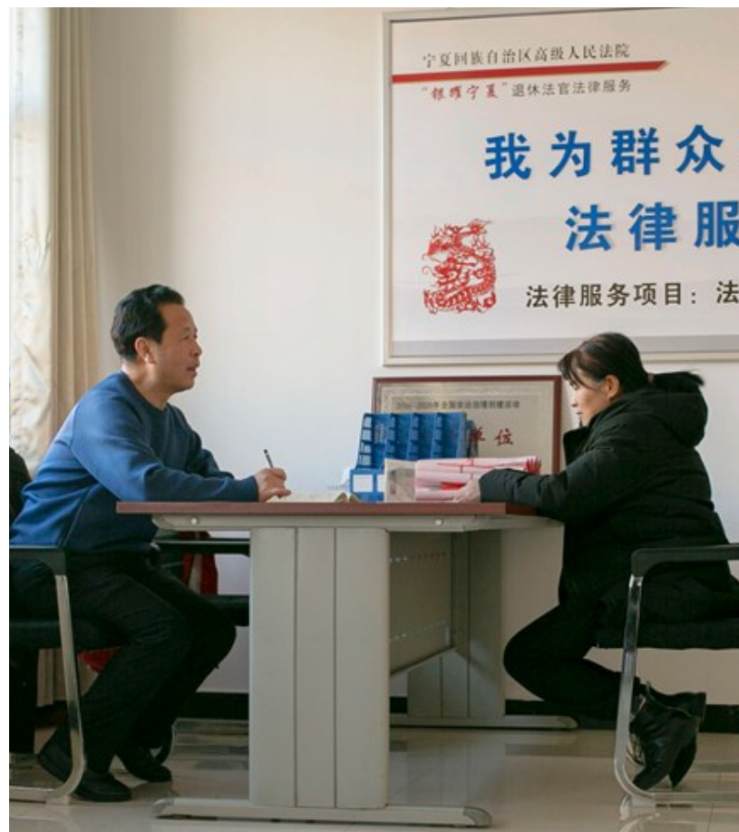
辖区群众前来咨询法律问题。