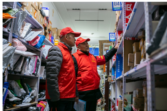
在快递驿站为每个包裹贴上反诈小贴士。