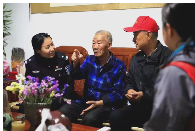
民警联合“金盾余晖”志愿者开展入户走访。