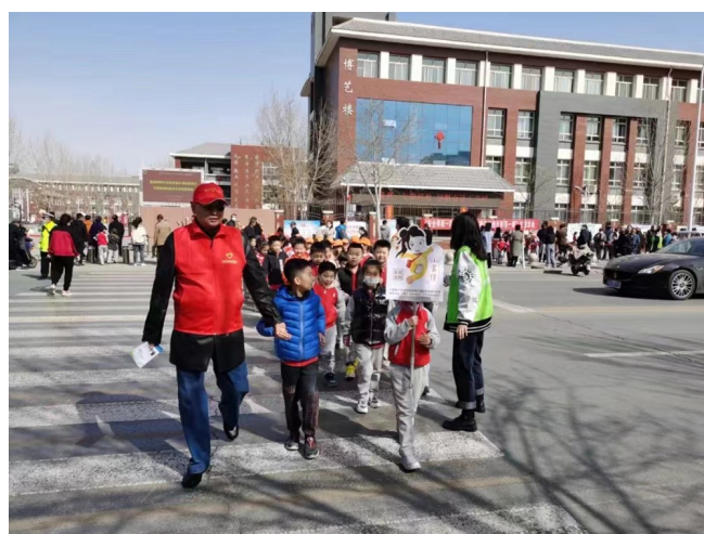
志愿者服务队坚守护学岗，为学生撑起“安全伞”。