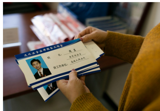
退休法官名签上标注了履历简介。

“银耀宁夏”退休法官法律咨询服务室的建立，是我区法律志愿服务的有益探索，退休法官们充分发挥自身优势，为街道、为社区居民解法疑、解心结、促和谐，进一步促进社会服务机制完善、创新。