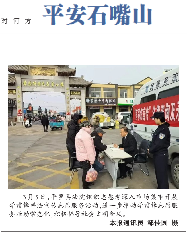
3月5日，平罗县法院组织志愿者深入市场集市开展学雷锋普法宣传志愿服务活动，进一步推动学雷锋志愿服务活动常态化，积极倡导社会文明新风。

关于被告马某称涉案房屋有质量问题，某物业服务公司不作为，应当由某置业公司、某物业服务公司承担维修及向原告赔偿的责任的意见，根据《房屋建筑工程质量保修办法》第7条第1款第（二项）、第17条的规定，屋面防水工程、有防水要求的卫生间、房间和外墙面的防渗漏的保修期为5年，因使用不当或者第三方造成的质量缺陷不在保修范围内。涉案房屋卫生间渗漏水工程已过保修期，而且被告马某在装修时对涉案漏水卫生间地面进行了防水处理，其要求某置业公司承担责任没有法律及事实依据。涉案漏水管道系房屋建筑区划内的专有部分，不属于物业维修、养护的义务范围，被告某物业服务公司在涉案卫生间发生漏水事宜后，积极检查漏水原因，并沟通维修事宜已尽到了物业服务责任，其要求某物业服务公司承担责任没有法律及事实依据。 后法院判决，被告及时维修楼下业主受损处墙面及设施，并给予损失赔偿2000元。